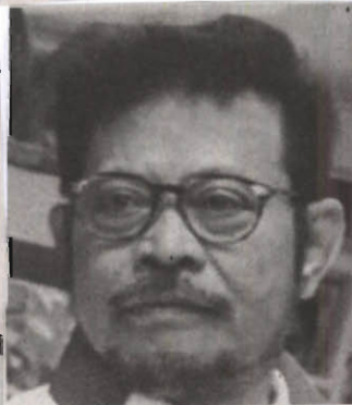
Syahrul Yasin Limpo

Mentan bersyukur komoditas subsektor peternakan itu mendapat dukungan Menteri Perdagangan M Lutfi. Dukungan terhadap komoditas SBW disampaikannya saat peluncuran Platform Dagang Digital Indonesian Store (IDNStore) di Jakarta, Kamis (14/1). Menteri Lutfi meyakini pertumbuhan yang ditargetkan RPJMN (Rencana Pembangunan Jangka Menengah Nasional) akan tercapai dan komoditas ekspor SBW menjadi andalan, bahkan seba-