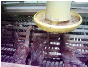
Gambar 2. Contoh kandang kelompok