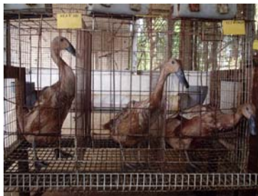
Gambar 3. Contoh kandang baterai (individu)