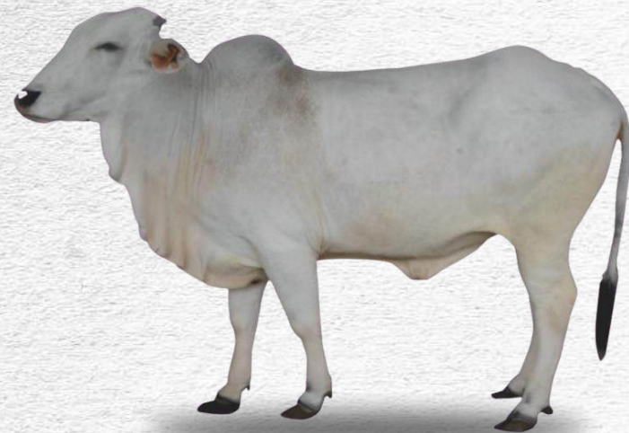
Bibit sapi pogasi agrinak jantan muda

Bibit jantan: sehat; tidak cacat fisik; organ reproduksi normal (testis baik dan simetris); dan memiliki silsilah minimum satu generasi