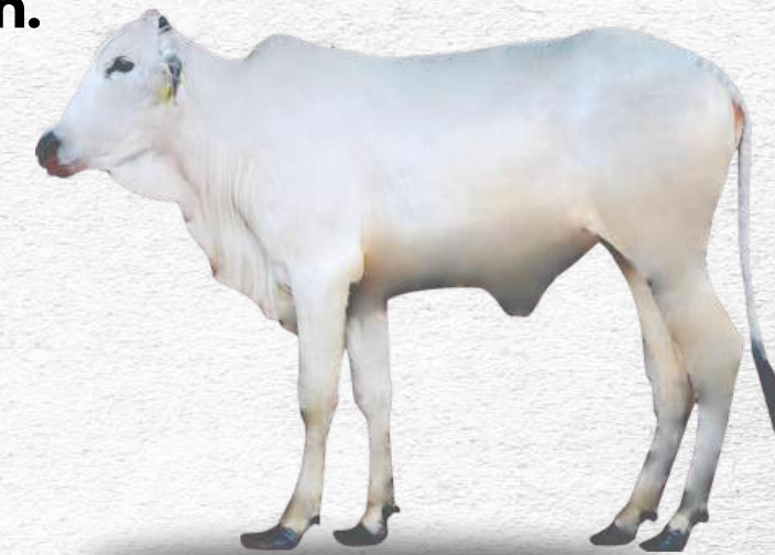
Bibit sapi pogasi agrinak betina muda

Bibit betina: sehat, tidak cacat fisik; ambing simetris, jumlah puting 4 (empat), bentuk puting normal; organ reproduksi normal; dan memiliki silsilah.