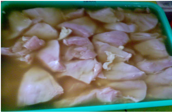
Gambar 3. Aplikasi bakteriosin pada daging ayam dengan metode perendaman selama 30 menit