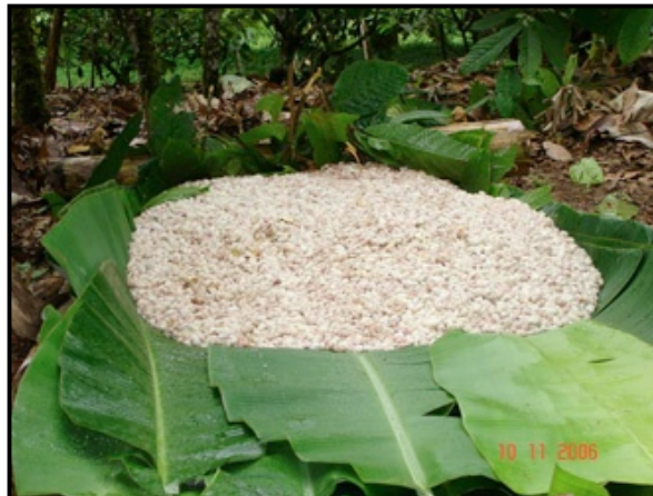
Gambar 6. Biji kakao siap difermentasi dalam tumpukan

Metode fermentasi tumpukan dilakukan dengan cara menimbun atau menumpuk biji kakao segar di atas daun pisang hingga membentuk kerucut. Permukaan atas biji ditutup dengan daun pisang atau karung atau penutup lainnya yang memungkinkan udara masuk. Penutupan berfungsi untuk mencegah pembuangan panas yang terlalu besar.