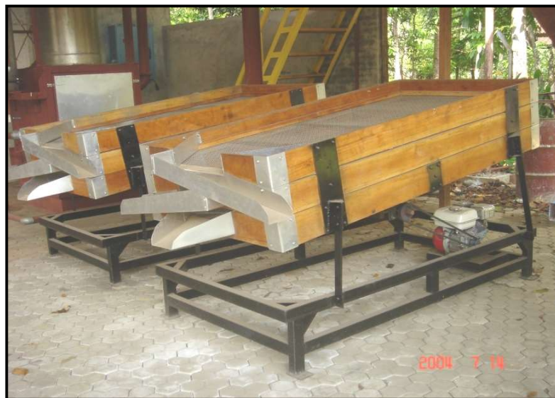
Gambar 21. Mesin sortasi tipe datar dengan getaran

90 untuk setiap 100 g. Mutu B adalah golongan biji dengan ukuran medium dan mempunyai jumlah biji antara 95 – 110 untuk setiap 100 g. Sedang, mutu C adalah golongan biji dengan ukuran kecil dan mempunyai jumlah biji di atas 120 untuk setiap 100 g. Biji pecah keluar dari ayakan paling bawah untuk mesin tipe getar atau ayakan paling depan untuk tipe silinder. Untuk biji dengan ukuran sangat besar masuk golongan mutu AA dengan jumlah biji kurang dari 85. Biji dengan mutu AA keluar lewat corong ayakan paling atas untuk mesin tipe getar atau ayakan paling ujung belakang untuk mesin tipe berputar.