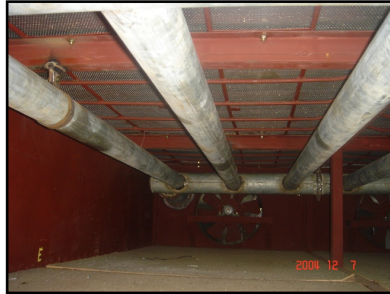
Gambar 17. Pipa pemindah panas