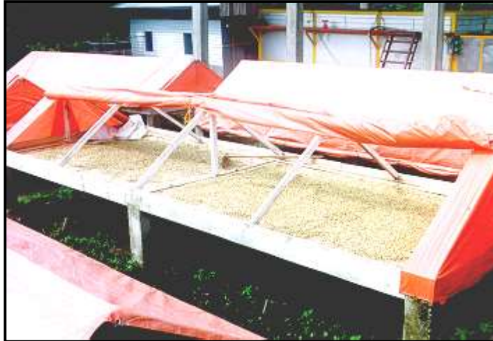
Gambar 12. Penjemuran dengan para-para

Penjemuran termasuk dalam mekanisme pengeringan lambat karena laju penggunaan air dari permukaan biji berlangsung secara perlahan, yaitu kurang dari 1 % per jam. Dari aspek mutu, cara ini dianggap menguntungkan karena dengan pengeringan lambat, kulit biji kakao tidak mengkerut dan mengeras secara mendadak. Akibatnya, senyawa asam, sebagai produk proses fermentasi yang ada di dalam biji, mempunyai kesempatan untuk menguap bersama dengan molekul air tanpa mengalami hambatan. Sebaliknya, cara penjemuran tidak sepenuhnya dapat mengakomodir kebutuhan produksi. Di beberapa sentra penghasil kakao, penjemuran biji kakao sering tidak dapat dilakukan dengan baik karena panen besar biasanya bertepatan dengan musim hujan. Waktu penjemuran dapat mencapai lebih dari 14 hari sehingga potensi pertumbuhan jamur pada biji menjadi besar.