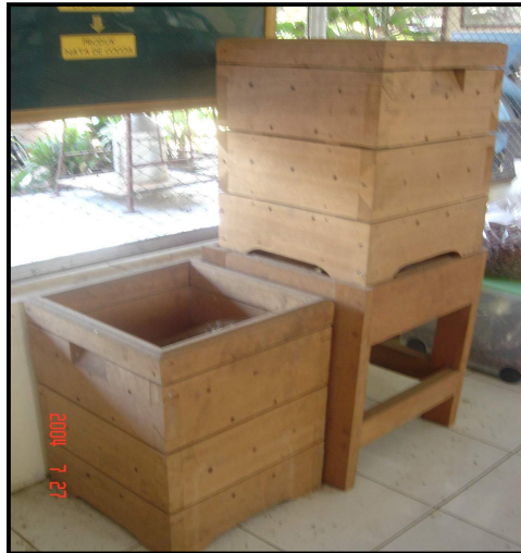
Gambar 4. Fermentasi dalam kotak berlubang skala individu

Kotak fermentasi banyak digunakan oleh perkebunan-perkebunan besar dengan kapasitas besar yaitu sekitar 1.000 kg/kotak dengan kedalaman sekitar 90 cm. Lama fermentasi biji kakao lindak pada perkebunan besar adalah antara 5 – 7 hari, biasanya pembalikan dilakukan setiap hari. Biji kering yang dihasilkan dari kotak dengan pembalikan atau pengadukan setiap hari memiliki derajat fermentasi yang baik, tetapi tingkat keasamannya tinggi sehingga cenderung kurang disukai oleh pabrikan cokelat