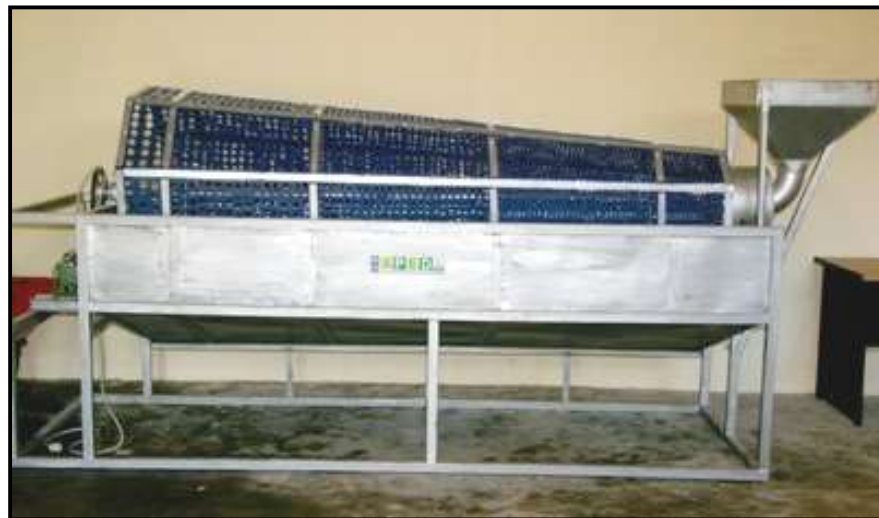
Gambar 20. Mesin sortasi tipe silinder berputar

Salah satu aspek mutu biji kakao yang sangat penting bagi konsumen adalah keseragaman ukuran biji. Sortasi ditujukan untuk mengelompokkan biji kakao berdasarkan ukuran fisiknya dan sekaligus memisahkan kotoran-kotoran yang tercampur di dalamnya. Mesin sortasi ukuran yang umum digunakan adalah jenis silinder berputar atau jenis datar dengan getaran dengan kapasitas antara 500 –1.250 kg per jam (gambar 20 dan 21)