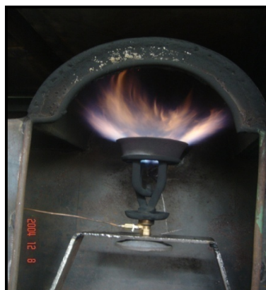
Gambar 16. Burner sebagai sumber panas.