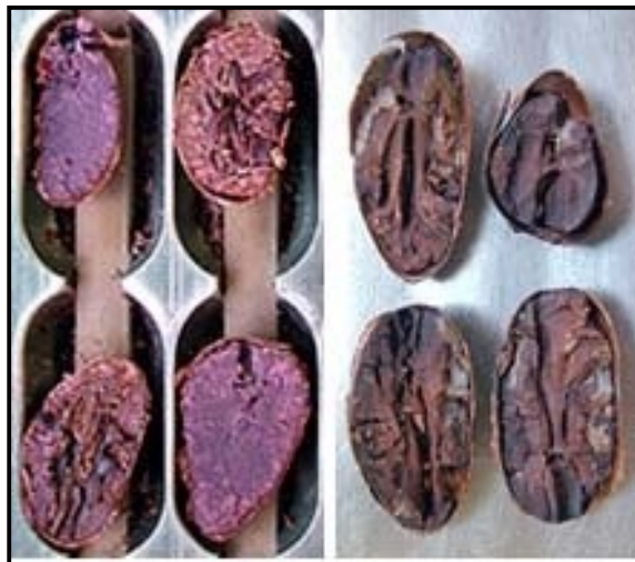
Gambar 2. Biji hasil fermentasi yang tidak baik dan yang baik

Faktor yang berpengaruh terhadap keberhasilan fermentasi adalah wadah fermentasi, waktu, aerasi, pembalikan, aktivitas mikroba dan penguraian kandungan pulp. Penguraian kandungan pulp ditentukan dengan lamanya pemeraman buah kakao setelah dipetik.