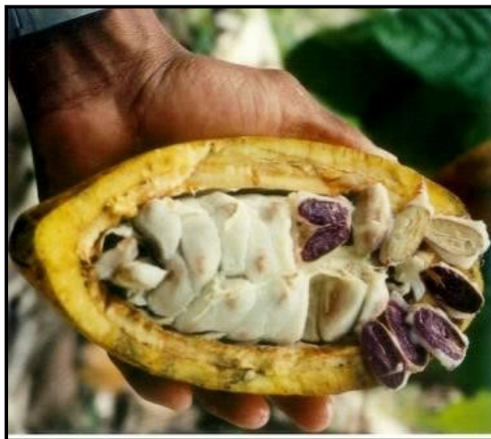
Gambar 1. Kakao Segar dengan Pulp

Fermentasi pada awal sejarahnya hanya digunakan untuk membebaskan biji kakao dari pulp, mencegah pertumbuhan, memperbaiki kenampakan, dan mempermudah pengolahan berikutnya di pabrik cokelat. Namun, pada perkembangan selanjutnya, fermentasi menjadi proses yang mutlak harus dilakukan. Tujuannya agar diperoleh biji kakao kering yang bermutu baik dan memiliki calon aroma serta cita rasa khas cokelat.