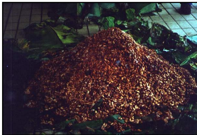
Gambar 8. Hasil akhir fermentasi dalam tumpukan