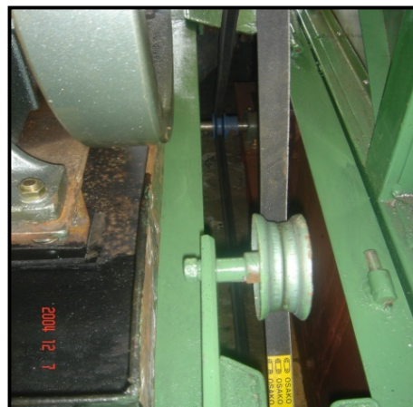
Gambar 15. Sistem transmisi alat pengering mekanis