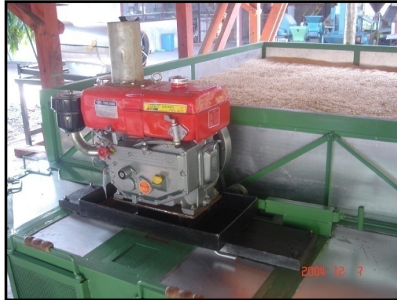
Gambar 14. Tenaga mesin pengering

air 23 %, tahap kedua penurunan kadar mulai selama kadar air berpindah dengan proses diffuse dan nib ke kulit biji (Bravo & McGaw, 1974).