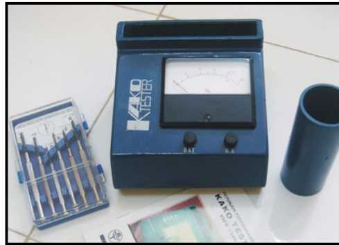
Gambar 19 Alat pengukur kadar air biji kakao

Kadar air kakao ditentukan dengan alat pengukur kadar air seperti terlihat pada gambar 19. Prinsip kerja alat pengukur kadar air ini relatif sederhana, namun mempunyai tingkat akurasi yang baik. Penentuan kadar air biji kakao merupakan salah satu tolok ukur proses pengeringan agar diperoleh mutu hasil yang baik dan biaya pengeringan yang murah. Selama proses pengeringan berjalan, selain melihat tampilan fisik biji kakao, kadar air perlu diukur dengan pengukur kadar air yang sudah terkalibrasi.