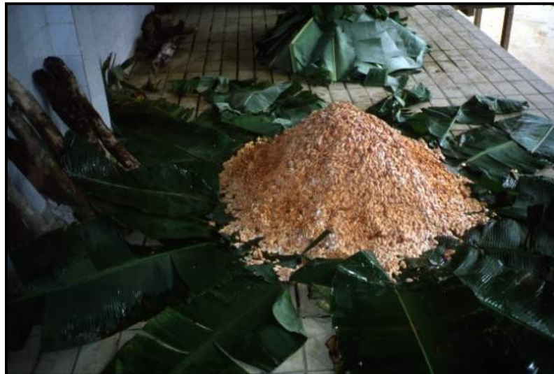
Gambar 7. Fermentasi dalam tumpukan dalam tahap awal

Pada metode ini, pekebun dianjurkan untuk melakukan fermentasi selama 6 hari dengan pengadukan sebanyak dua kali, tetapi umumnya sebagian besar petani hanya melakukan fermentasi selama 3 – 5 hari dan pengadukan dilakukan hanya sekali atau tidak sama sekali. Di Republik Dominika, fermentasi hampir tidak dilakukan, biji hasil pemecahan dihamparkan di atas lantai pengering. Jika hasil panen cukup banyak, lapisan biji cukup tebal dan beberapa perubahan terjadi seperti saat fermentasi, tetapi pada umumnya hasilnya punya kualitas yang buruk dan mengandung biji tidak terfermentasi cukup tinggi.