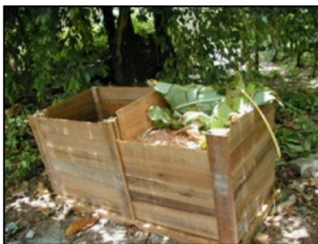
Gambar 3. Fermentasi dalam kotak dua susun

Fermentasi dalam kotak banyak diterapkan di Asia Tenggara dan Amerika Latin. Fermentasi ini melibatkan penggunaan kotak kayu yang kuat yang dilengkapi dengan lubang-lubang di dasar kotaknya yang digunakan sebagai pembuangan cairan fermentasi atau lubang untuk keluar masuknya udara (aerasi). Biji dalam kotak fermentasi ditutup dengan daun pisang atau karung goni. Tujuannya adalah untuk mempertahankan panas. Selanjutnya diaduk setiap hari atau setiap dua hari selama kurun waktu fermentasi (4 – 7 hari)