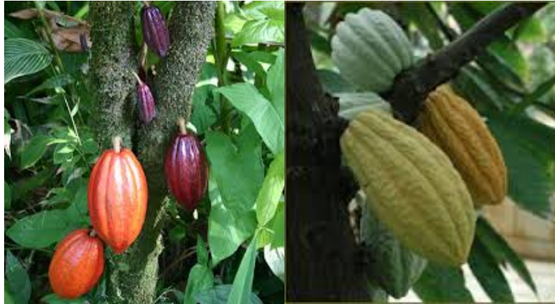
Gambar. 1 buah kakao

Panen buah muda akan menghasilkan biji kakao bercitarasa khas cokelat tidak maksimal, rendemen yang rendah, persentase biji pipih (flat bean) tinggi dan kadar kulit bijinya juga cenderung tinggi.