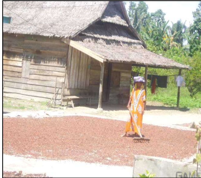
Gambar 11. Penjemuran di lantai jemur

Tindakan ini tidak memenuhi standar karena gampang tercampur dengan pasir atau batu krikil. Pada saat kendaraan lewat atau melintas, biji-biji kakao terkontamisi_atau kena abu sehingga menurunkan mutu.