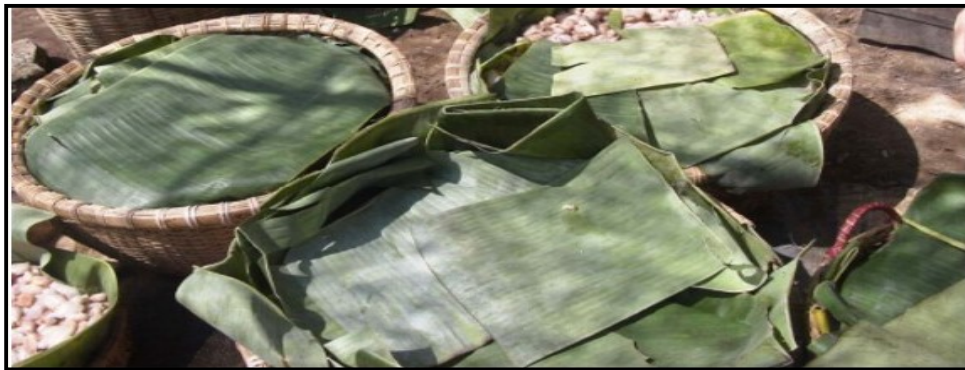
Gambar 10. Fermentasi dalam keranjang

Pada metode ini, biji segar hasil panen dimasukkan ke dalam keranjang bambu atau rotan yang telah dilapisi daun pisang dengan kapasitas lebih dari 20 kg. Permukaan biji ditutup dengan daun pisang atau karung. Seperti hal fermentasi dalam kotak maupun tumpukan, fermentasi dalam keranjang juga membutuhkan perlakuan pengadukan yang harus dilakukan setelah 48 jam (2 hari) fermentasi.