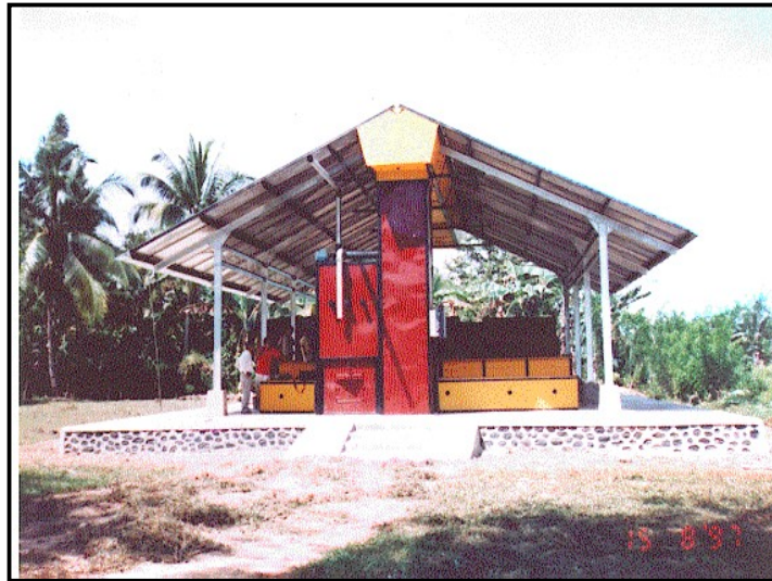
Gambar 18. Pengerinan terpadu, fermentasi dan pengerinan satu atap

Selama periode laju konstan, laju pengeringan tergantung pada suhu udara panas dan laju aliran udara, tetapi selama penurunan laju, suhu merupakan faktor yang paling utama. Suhu dan laju udara merupakan dua faktor kunci yang berpengaruh terhadap pengeringan, ketebalan biji merupakan yang ketiga. Tiga faktor utama tersebut telah dipelajari oleh Shelton (1967), yang melakukan sejumlah percobaan skala kecil dengan peralatan khusus. Dengan pembatasan percobaan-percobaan tersebut menunjukkan bahwa ketebalan biji 25 cm, laju aliran udara 0,05 m/detik dan suhu pengeringan 60 – 65° C akan memberikan hasil yang paling ekonomis.