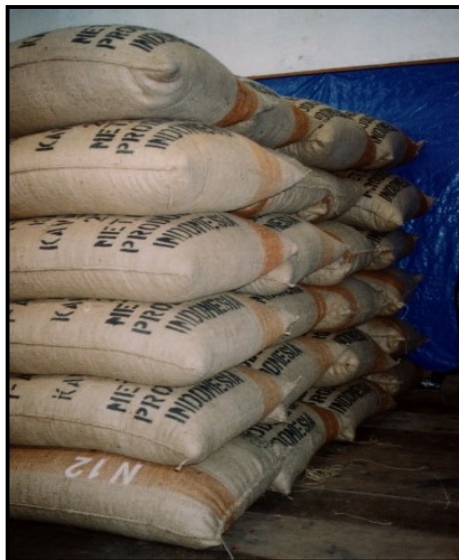
Gambar 23. Kemasan untuk Pasar Ekspor