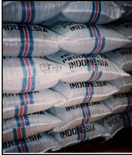
Gambar 22. Kemasan Kakao untuk Pasar Lokal

Biji kakao disimpan di dalam ruangan yang bersih, dengan kelembaban udara tidak lebih dari 75%, ventilasi udara cukup, dan tidak bercampur dengan produk pertanian lainnya yang beraroma keras [menyengat] karena biji kakao mudah menyerap bau-bauan.