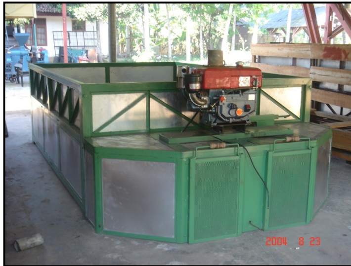
Gambar 13. Pengering mekanis

tinggi ( > 60^{\circ}\text{C} ) hendaknya dihindari karena dikhawatirkan akan merusak citarasa biji kakao. konsumsi minyak tanah untuk pengeringan berkisar antara 3-4 liter/jam. Sedangkan konsumsi kayu untuk pengeringan berbahan bakar kayu adalah antara 15-20 kg per jam tergantung pada kadar air kayu bakarnya. Penggunaan kayu bakar dapat meningkat 2 kali lebih besar jika kadar air diatas 30 %. Untuk itu kayu bakar sebaiknya dikering anginkan selama 2 minggu sampai kadar airnya mencapai 20-22 % (Sri Mulato, 2001).