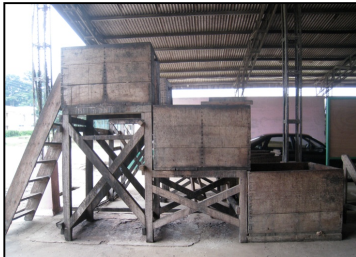
Gambar 5. Fermetasi dalam kotak tiga tingkat