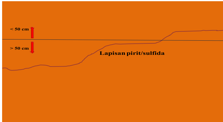
Gambar 1. Ilustrasi kedalaman lapisan pirit/sulfida di dalam tanah pada lahan sulfat masam

Secara umum, produktivitas lahan rawa pasang surut masih sangat rendah. Hal tersebut disebabkan karakteristik fisika dan kimia tanahnya yang dinilai sangat jelek dan lahannya termasuk dalam kelas kesesuaian S3 (sesuai bersyarat). Lahan rawa pasang surut juga dikenal sebagai lahan bermasalah atau lahan sub-optimal (LSO), artinya lahan rawa pasang surut memerlukan pengelolaan yang intensif dan pemberian masukan ( input ) berupa bahan amelioran dan pupuk (organik dan anorganik) yang cukup untuk meningkatkan produktivitasnya (Alihamsyah et al. , 2003; Noor 2004; Nursyamsi et al. , 2014a; Simatupang et al. , 2017). Hasil analisa tanah berikut menggambarkan beberapa karakteristik fisika dan kimia pada di lahan potensial dan lahan sulfat masam (Tabel 1).