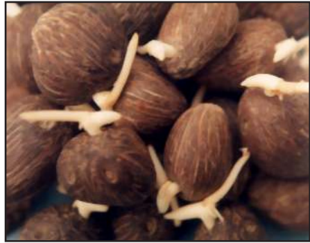
Gambar 2: Kecambah Kelapa Sawit