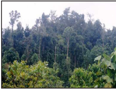
Gambar 7. Hutan Sekunder

tahun pertama maka dilakukan rintisan yang serupa dengan rintisan pada pembuatan studi kelayakan namun lebih mendetail untuk mengetahui secara pasti vegetasi, topografi, sumber air, drainase serta batas dan luas areal. Selanjutnya berdasarkan peta hasil rintisan dibuat perencanaan jalan, lokasi pemondokan sementara, pembagian blok besar dan kecil untuk persiapan pemborongan pekerjaan, arah pembukaan lahan dan lain-lain.