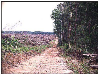
Gambar 9. Pembukaan Lahan