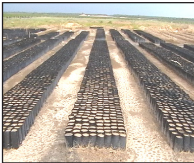
Gambar 3: Persiapan Pembénihan Awal