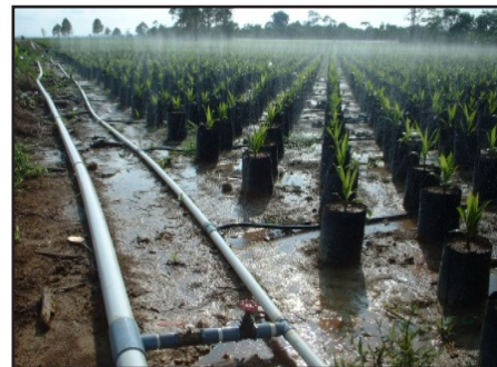
Gambar 6: Pembénihan Utama