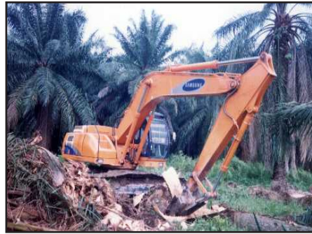
Gambar 12. Penumbangan dan Pencacahan (Peremajaan)