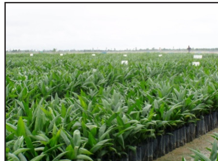
Gambar 4: Pembénihan Awal