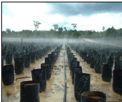
Gambar 5: Persiapan Pembénihan Utama