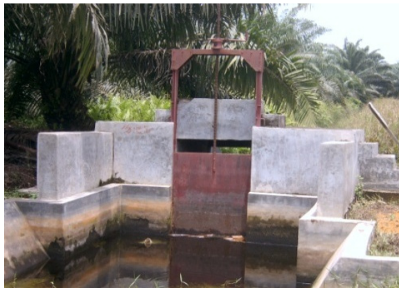
Gambar 13 . Pintu Kanal Permanen