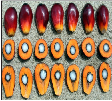
Gambar 1: Benih unggul