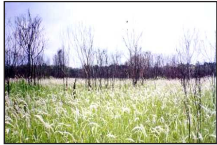
Gambar 8. Hutan Lalang