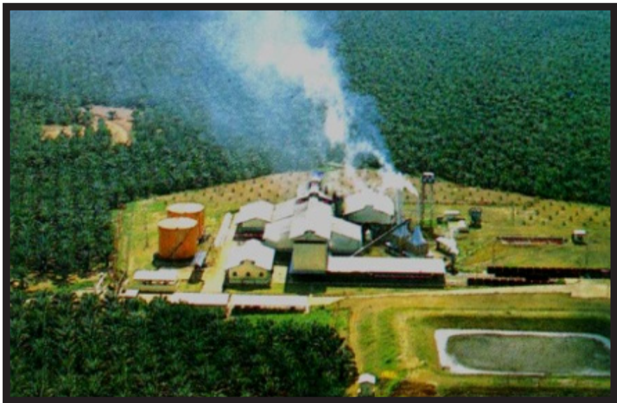
Gambar 17. Pabrik Kelapa Sawit (PKS)