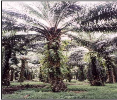
Gambar 11. Tanaman Kelapa Sawit Tua