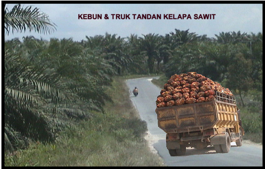
Gambar 16. Transportasi TBS