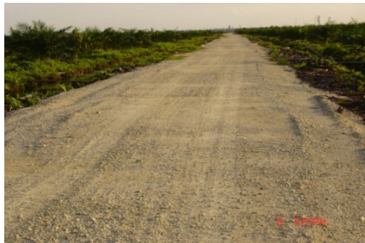
Gambar 14. Jalan yang Terbangun dengan Baik di Areal Gambut