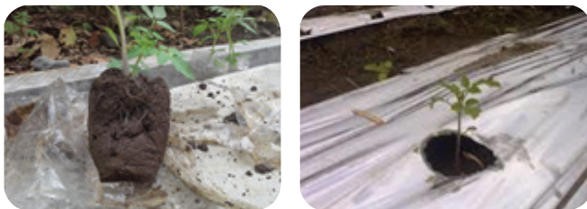
Gambar 6. Penanaman Tomat

Bibit dari persemaian tertanam pada lokasi dan jarak tanam yang telah ditentukan sehingga tanaman tumbuh dengan baik dan optimal.