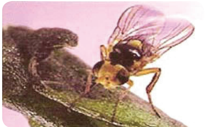
Gambar 16. Pengorok Daun, L. huidobrensis .

Kerusakan yang diakibatkan gorokan larva dapat mengakibatkan mengurangi kapasitas fotosintesis tanaman serta dapat mengugurkan daun pada tanaman muda. Di daerah tropis tanaman yang terserang tampak seperti terbakar. Selain dapat mengakibatkan kerusakan secara langsung luka bekas gigitan pada tanaman dapat terinfeksi oleh fungi maupun bakteri penyebab penyakit.