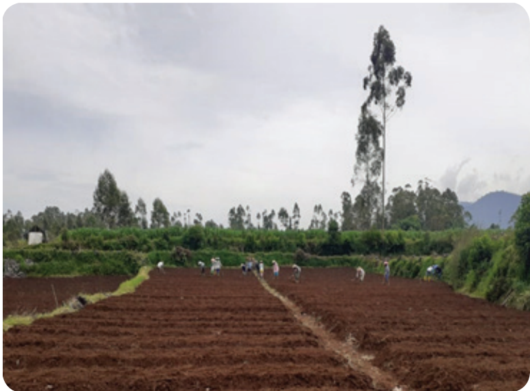
Gambar 2. Persiapan Lahan

Kegiatan persiapan lahan adalah kegiatan mempersiapkan lahan yang sesuai untuk pertumbuhan tanaman, meliputi kegiatan persiapan/pengolahan lahan, pemupukan dasar dan pemasangan mulsa plastik.