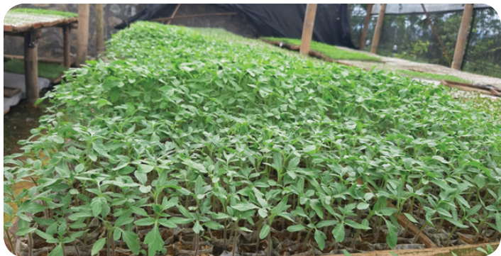
Gambar 1. Persemaian Tomat