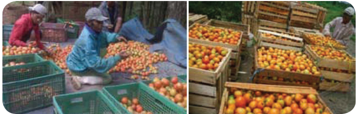
Gambar 19. Sortasi Tomat