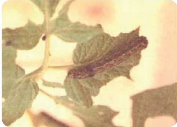
Gambar 15. Ulat grayak, S. litura .

Penyakit ini disebabkan oleh Spodopterae litura F, gejala serangan pada daun oleh larva instar satu dan dua, berupa bercak-bercak putih menerawang, serangan oleh larva dewasa menyebabkan daun berlubang-lubang tinggal tulang daun. Gejala serangan pada buah ditandai dengan timbulnya lubang-lubang tidak beraturan pada buah tomat.