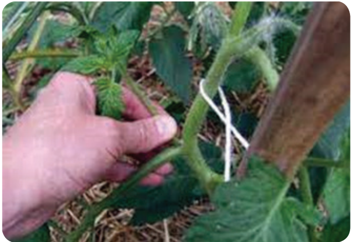
Gambar 8. Perempelan Tunas Ketiak