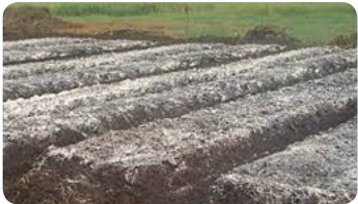
Gambar 4. Pemberian Dolomit/Kapur