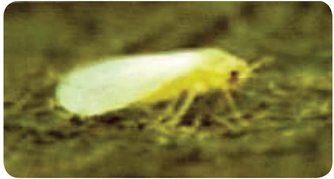
Gambar 14. Kutu kebul, B. tabaci