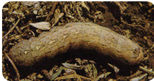
Gambar 11. Ulat tanah, A. ipsilon .

Gejala khas ditandai dengan terpotongnya tanaman pada pangkal batang, sehingga tanaman mati muda. Ulat ini bersembunyi di dalam tanah dan keluar pada malam hari.