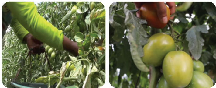
Gambar 18. Panen Tomat