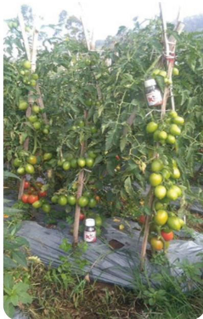
Gambar 10. Perangkap Hama