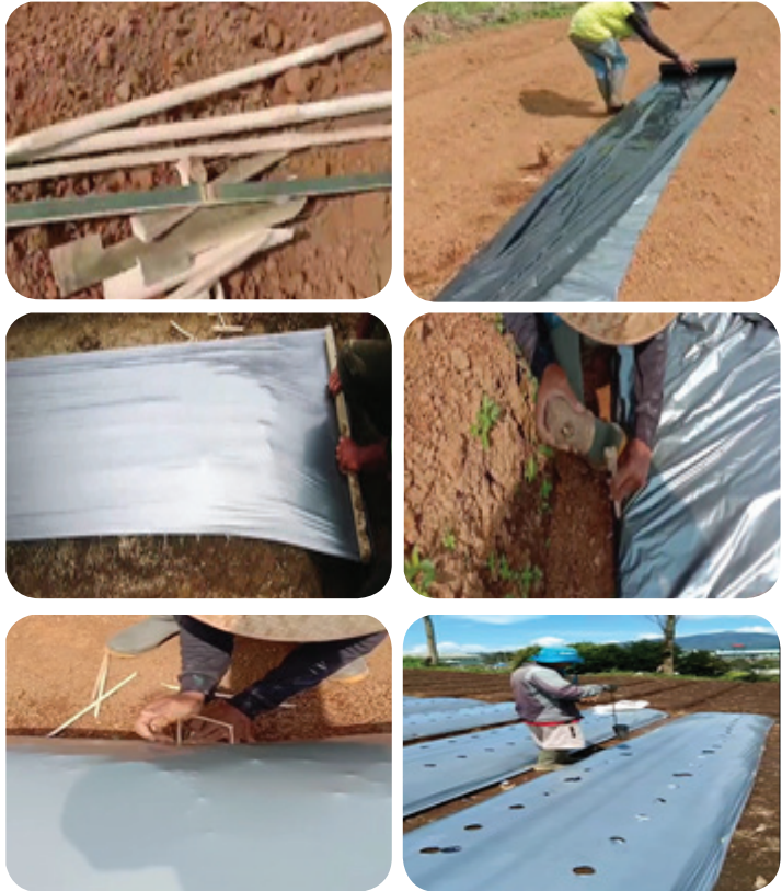
Gambar 5. Pemasangan dan pembuatan lubang tanam pada mulsa.