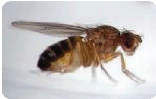
Gambar 12. Lalat buah, Bactrocera spp.

Ciri Mat buah atau Bactrocera spp. adalah berwarna coklat kekuningan dengan garis kuning membujur pada punggung. Lalat ini umumnya menyerang dengan cara memasukan ovipositor menyuntikan telur-telurnya kedalam kulit buah tomat. Telur-telur tersebut kemudian akan berubah menjadi larva dan mengerogoti buah dari dalam hingga menjadi busuk dan rontok.