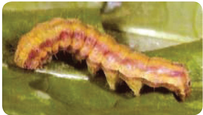
Gambar 13. Ulat buah, H. armigera .

Larva melubangi buah tomat. Buah yang terserang busuk dan jatuh ke tanah, kadang larva juga menyerang pucuk tanaman dan melubangi cabang-cabang tomat.