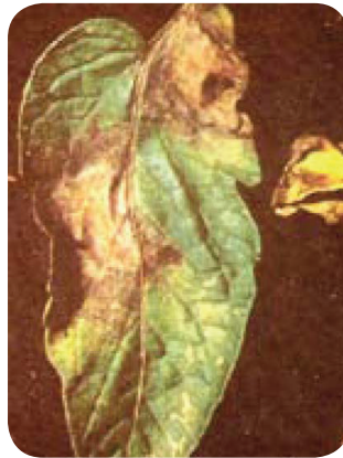
Gambar 17. Gejala penyakit busuk daun.

keabu-abuan. Daun yang terserang menjadi busuk dan akhirnya menguning dan coklat. Apabila buah yang terserang menunjukkan bercak-bercak berwarna coklat kehijau-hijauan dan sedikit bergelombang serta basah. Bila kondisi lembab pada permukaan bercak tumbuh benang-benang halus berwarna abu-abu.