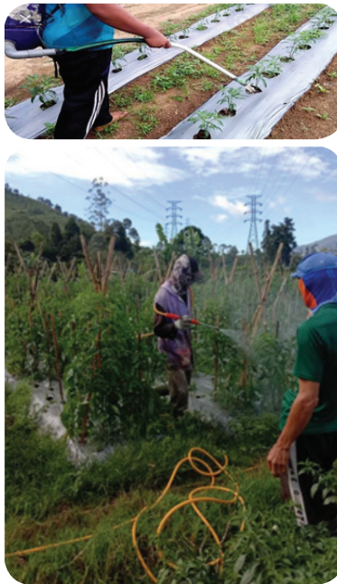
Gambar 9. Penyiraman

Terjaminnya ketersediaan air bagi tanaman sesuai kebutuhan sehingga pertumbuhan dan proses produksinya berjalan optimal.