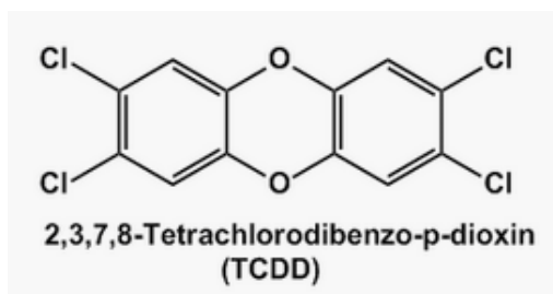
Gambar 1. Struktur kimia 2,3,7,8-tetrachlorodibenzo-p-dioxin

CDF ( Chlorinated Dibenzo Furan ) atau PCB ( Poly-Chlorinated Biphenyl ). Ada ratusan senyawa yang termasuk dioksin dan salah satunya yang paling beracun adalah TCDD ( 2,3,7,8-tetrachlorodibenzo-p-dioxin ). Senyawa-senyawa dioksin mempunyai struktur kimia yang sangat stabil dan bersifat lipofilik atau tidak mudah larut dalam air namun mudah larut di dalam lemak. Karena kestabilan strukturnya ini, maka dioksin tidak mudah rusak atau terurai. Dioksin dapat berada di dalam tanah dan terakumulasi sampai 10-12 tahun. Karena bersifat lipofilik, maka dioksin dapat terakumulasi dalam pangan yang punya kadar lemak tinggi. Misalnya, susu, daging (sapi, babi maupun unggas), mentega, keju, telur bahkan ikan (Susanti, 2004).