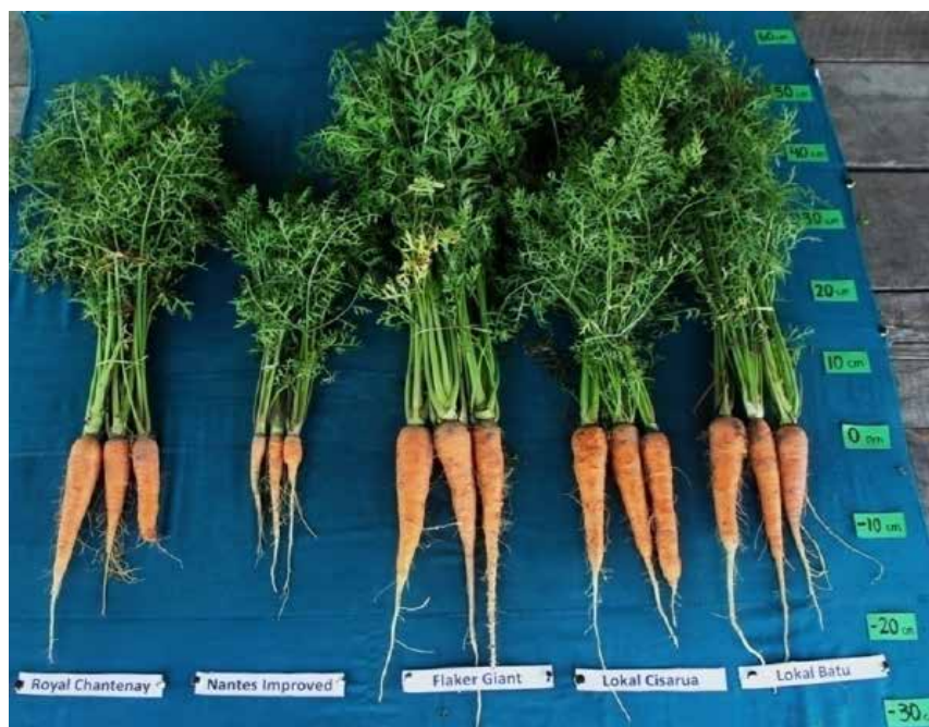
Gambar 2. Kondisi berbagai varietas wortel pada umur panen 91 HST di dataran rendah Palangka Raya ( Performance of several variety of carrot at the age of 91 DAP in lowland areas of Palangka Raya )

dan Royal Chantenay masing-masing 0,8 kg/m 2 , 0,5 kg/m 2 dan 0,32 kg/m 2 . Khusus untuk varietas Nantes Improved, umbi yang terbentuk dalam kondisi tidak layak konsumsi sehingga tergolong gagal panen.