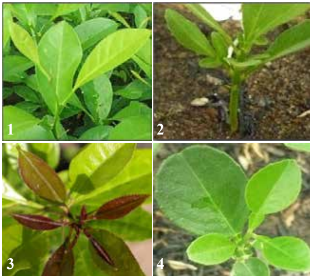
Gambar 2. Semaian JC true to type (1) dan off type (2,3,4) (JC seedling of true to type (1) and off type (2,3,4))

warna kulit buah. Gambar 3 menunjukkan semakin masak benih warna embrio dominan semakin berwarna krem dan tidak terlihat adanya warna kehijauan. Warna hijau pada embrio disebabkan adanya klorofil. Semakin masak benih warna hijau memudar dan pada tahap akhir tingkat kemasakan benih tidak terdapat warna hijau pada embrio. Saat benih masak terjadi perubahan warna yang disebabkan klorofil mengalami degradasi (Werker 1997). Benih dengan dua embrio umumnya menunjukkan tingkat kemasakan embrio yang hampir sama (Gambar 3A), sedangkan benih dengan lebih dari tiga embrio menunjukkan tingkat kemasakan yang beragam (Gambar 3C) dengan bentuk embrio yang tidak beraturan (Gambar 3D dan 3E). Hasil penelitian Soares-Filfo et al. 1992 menunjukkan apabila jumlah embrio per benih semakin banyak keragaman tingkat kemasakan embrio di dalam benih semakin tinggi karena tingginya kompetisi antarembrio.