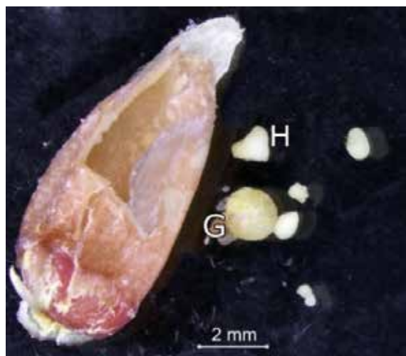
Gambar 4. Biji dari buah tingkat kemasakan V dengan embrio-embrio yang tidak berkembang sampai dengan fase hearth. G. fase globular, H: fase hearth (Seed from 5 th maturity level which are undevelopment embryos hearth phase G. globular phase, H. hearth phase)

Indeks vigor, kecepatan tumbuh, dan daya berkecambah mempunyai kecenderungan meningkat dan optimum pada benih dari buah tingkat kemasakan IV kemudian menurun pada tingkat kemasakan V. Benih dari buah tingkat kemasakan IV mencapai masak fisiologis, sehingga benih dapat dipanen pada buah dengan ciri warna kulit kuning 90% merata, warna kulit benih krem kecoklatan, dan warna embrio krem. Penelitian Hamilton et al. 2007 pada C. garrawayi juga menunjukkan bahwa benih masak dengan kulit warna krem lebih cepat berkecambah dibandingkan dengan benih belum masak yang berwarna kehijauan.