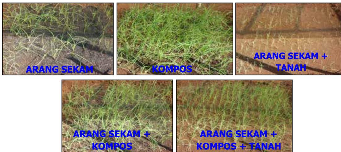
Gambar 1. Pertumbuhan tanaman bawang merah asal TSS pada umur 28 HST pada berbagai media tanam ( Growth of shallot at 28 DAP plant from TSS in different growing media )

mati. Berbeda dengan media yang agak padat seperti tanah maupun kompos, akar tanaman tidak keluar di permukaan media sehingga tidak banyak tanaman yang rebah. Populasi tanaman menurun pada umur 56 HST dan banyaknya populasi tanaman yang bertahan juga dipengaruhi oleh jenis media tanam. Pada umur tersebut media tanam yang paling baik adalah campuran arang sekam + kompos + tanah sebanyak 21,30%. Media tanam tersebut mempunyai komposisi yang paling tepat untuk perkembangan akar tanaman terutama ditinjau dari kegemburan media. Adanya arang sekam dan kompos pada komposisi media tersebut dapat mengurangi kepadatan media dan membentuk aerasi yang cukup sehingga akar berkembang lebih