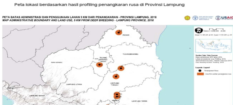
Gambar 2. Peta batas administrasi penangkaran radius 5 km