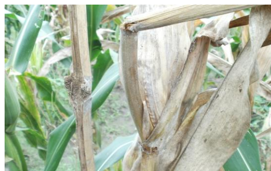
Gambar 2b. Gejala penyakit busuk batang dan busuk tongkol pada tanaman jagung (gambar: Subiadi, 2012).