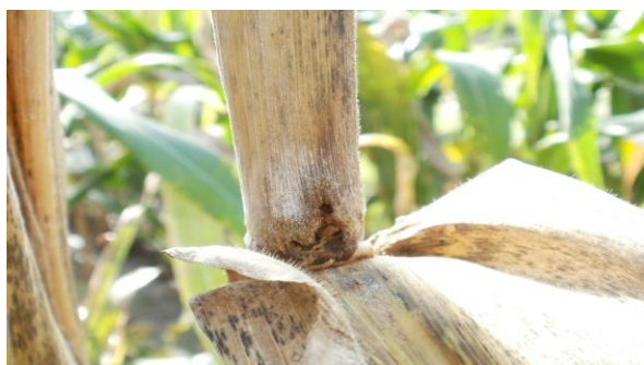
Gambar 2a. Lubang bekas gerakan larva penggerek batang jagung pada batang jagung yang terserang penyakit busuk batang (gambar: Subiadi, 2012).

penggerek batang jagung O. nubilalis menjadi tempat awal infeksi fusarium sp. Di mana spora jamur Fusarium sp. terbawa oleh penggerek batang dari permukaan tanaman ke bagian tanaman yang luka (Sweet & Simeon, 2008; Czembor et al. , 2010), atau larva penggerak batang membuat luka gerakan pada batang dan tongkol sehingga walaupun larva tidak secara langsung membawa jamur kedalam batang, tumpukan spora jamur pada bagian batang yang luka sangat cocok untuk perkecambahan spora dan menginfeksi tanaman (Czembor et al. , 2010).