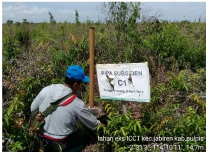
Gambar 6. Pipa Subsiden C1 yang terletak disemak belukar, dengan jarak 25 m dari saluran drainase