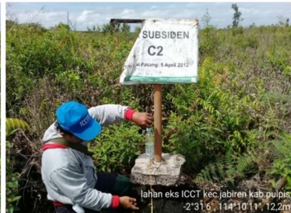
Gambar 7. Pipa Subsiden C2 yang terletak disemak belukar, dengan jarak 100 m dari saluran drainase