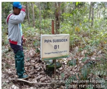
Gambar 4. Pipa Subsiden B1 yang terletak diperkebunan karet rakyat yang belum menghasilkan, dengan jarak 25 m dari saluran drainase.