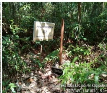
Gambar 5. Pipa Subsiden B2 yang terletak diperkebunan karet rakyat yang belum menghasilkan, dengan jarak 100 m dari saluran drainase.