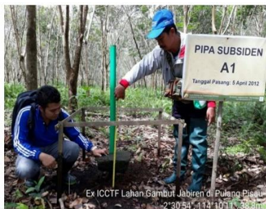
Gambar 2. Pipa Subsiden A1 yang terletak diperkebunan karet rakyat yang sudah menghasilkan, dengan jarak 25 m dari saluran drainase

Dari 6 pipa subsiden yang diamati ada 3 pipa subsiden yang penurunannya termasuk dalam klasifikasi sedang yaitu pipa subsiden A1, C1 dan C2. Pipa subsiden A1 yang terletak 25 m dari saluran drainase dan berada diperkebunan karet rakyat yang menghasilkan mengalami penurunan dengan klasifikasi sedang dikarenakan adanya drainase dan proses dekomposisi tanah gambut, sedangkan pipa subsiden C1 dan C2 yang terletak disemak belukar mengalami penurunan dengan klasifikasi sedang juga dikarenakan adanya saluran drainase dan terjadinya dekomposisi tanah gambutserta terjadinya kebakaran lahan pada tahun 2015.