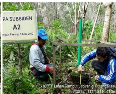
Gambar 3. Pipa Subsiden A2 yang terletak diperkebunan karet rakyat yang sudah menghasilkan, dengan jarak 100 m dari saluran drainase