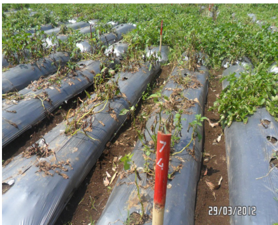
Gambar 1. Genotipe Atlantic, 6 MST ( Atlantic genotype , 6 WAP)

Klon-klon yang membawa gen RB mulai terserang penyakit hawar daun pada minggu ke-7 sehingga aplikasi fungisida dapat ditunda sampai dengan tanaman menjelang minggu ke-7. Sementara itu pada varietas yang peka seperti Granola dan Atlantic, aplikasi fungisida sudah mulai dilakukan sejak tanaman berumur 2 minggu setelah tanam (MST). Dengan demikian, penggunaan varietas yang tahan seperti pada genotipe klon 27, 65, 66, 20 dan Katahdin SP951 dapat menghemat penggunaan fungisida karena dapat menunda waktu aplikasi penggunaan fungisida.