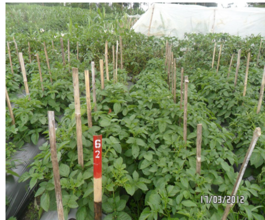
Gambar 2. Genotipe 62 (Granola x transgenik Katahdin SP951), 6 MST [ Genotype 62 (Granola x transgenik Katahdin SP951) , 6 WAP]