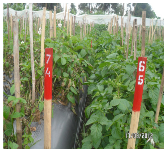
Gambar 4. Genotipe 65 (Granola x transgenik Katahdin SP951), 6 MST [ Genotype 65 (Granola x transgenik Katahdin SP951) , 6 WAP]