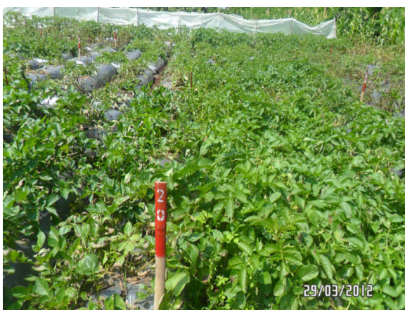
Gambar 3. Genotipe 20 (Atlantic x transgenik Katahdin SP951), 6 MST [ Genotype 20 (Atlantic x transgenik Katahdin SP951) , 6 WAP]