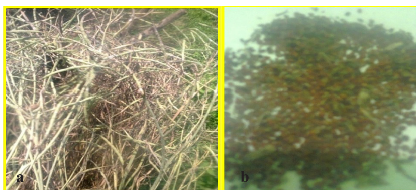
Gambar 3. Benih kubis bunga siap panen (a) dan biji kubis yang siap digunakan (b) [Cauliflower seed ready to harvest (a) and cauliflower seed ready to use (b)]

penanaman ( N_1 = tanpa naungan dan N_2 = menggunakan naungan). Penetapan dosis pupuk Boron diambil dari hasil penelitian Simatupang (1997) dan Darwin (1992) yang menyatakan bahwa produksi kubis bunga terbaik dihasilkan menggunakan dosis pupuk Boron 15 kg/ha dan 25 kg/ha. Prosedur yang dilakukan adalah benih disemai pada bumbun daun pisang. Setelah bibit berumur 25–30 hari atau berdaun empat, bibit dipindahkan ke lapangan. Bibit ditanam pada petak percobaan dengan ukuran lebar 1 m dan panjang 3 m, dengan jarak tanam 60 cm x 50 cm. Jarak antarperlakuan 60 cm, jarak antarulangan 100 cm. Dalam petak percobaan terdapat dua baris tanam dan dalam satu baris tanam terdapat lima tanaman. Pemeliharaan berupa penyiraman dilakukan secara rutin setiap 2 hari. Pupuk dasar yang diberikan adalah pupuk kandang ayam 200 g/tanaman dan pupuk anorganik dengan dosis N 200 kg/ha, P_2O_5 150 kg/ha, dan K_2O 125 kg/ha. Pupuk N diberikan dua kali, yaitu pada saat tanam dan setelah tanaman berumur 1 bulan. Pupuk P dan K diberikan seluruhnya pada saat tanam. Pemberian Boron dilakukan tiga kali, yaitu pada saat umur 1, 2, dan 3 bulan setelah tanam (BST) dengan dosis sesuai perlakuan. Pupuk Boron yang digunakan berasal