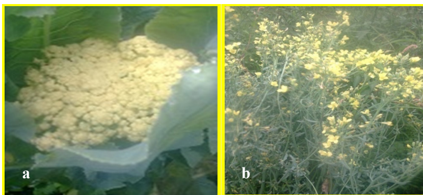
Gambar 1. Pohon induk kubis bunga siap disungkup (a) dan pertumbuhan kubis bunga selama penyungkupan (b) [ Cabbage mother plant ready to shade (a) and growing of cauliflower during shading (b) ]

Penelitian dilakukan di KP Berastagi mulai bulan Januari sampai Oktober 2014. Rancangan percobaan yang digunakan adalah rancangan acak kelompok (RAK) pola faktorial dengan empat ulangan. Faktor pertama adalah dosis pupuk Boron ( B_0 = tanpa pupuk Boron, B_1 = 5 kg/ha, B_2 = 10 kg/ha, B_3 = 15 kg/ha, B_4 = 20 kg/ha, B_5 = 25 kg/ha. Faktor kedua adalah teknik