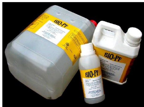
Gambar 4. Bio-PF, biopestisida cair berbahan aktif Pseudomonas fluorescens .

Gliocompost berbentuk tepung berwarna cokelat kehitam-hitaman. Mikroba yang terkandung dalam Gliocompost terdiri atas Gliocladium sp., P. fluorescens , dan B. subtilis yang diisolasi dan diseleksi dari rhizosfer tanaman cabai asal Sukabumi, Jawa Barat. Biopestisida ini efektif mengendalikan patogen tular tanah yang disebabkan oleh Fusarium spp., Pythium sp. (rebah kecambah), Ganoderma boninense , dan layu fusarium pada tanaman krisan. Aplikasi Gliocompost dapat