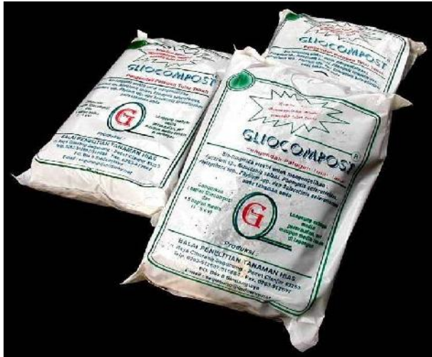
Gambar 5. Gliocompost, biopestisida berbentuk tepung dengan bahan aktif Gliocladium spp.

menekan patogen 30% dan mempertahankan hasil panen krisan 1,85% dibanding pupuk dan pestisida, serta mengurangi penggunaan pupuk dan pestisida sintetis 50%. Gliocompost telah mendapatkan paten dari Kementerian Hukum dan Hak Azasi Manusia RI dengan nomor sertifikat IDP000034666, 1 Oktober 2013 (Nuryani et al. 2013). Gliocompost telah dilisensi oleh PT Agro Indo Mandiri (AIM) Bogor pada 24 Desember 2014 dan telah digunakan secara meluas di Jawa Barat, Jawa Tengah, Jawa Timur, DKI Jakarta, Bali, Sumatera Selatan, dan Lampung.