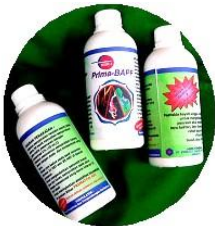
Gambar 3. Prima-BAPF, biopestisida produksi Badan Litbang Pertanian dengan bahan aktif Bacillus subtilis dan Pseudomonas fluorescens .

Biopestisida berbentuk cair ini berbahan aktif bakteri Pseudomonas kelompok fluorescens dengan nomor isolat