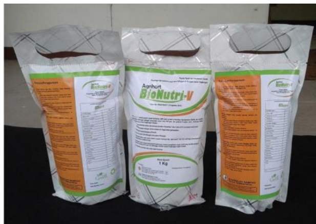
Gambar 2. Bentuk formulasi (kiri) dan kemasan Agrihort Bionutri-V (kanan).