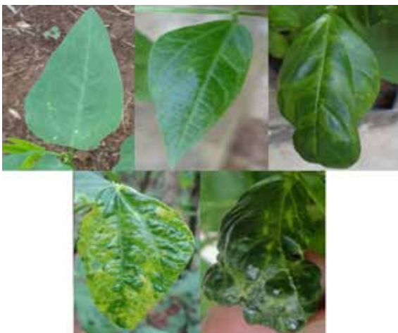
Gambar 1. Skor keparahan penyakit berdasarkan gejala. (a) skor 0, (b) skor 1, (c) skor 2, (d) skor 3, dan (e) skor 4 ( Disease severity scoring based on symptoms (a) score 0, (b) score 1, (c) score 2, (d) score 3, and (e) score 4 )

Seluruh data intensitas penyakit digunakan untuk membuat grafik perkembangan penyakit. Menurut Strange (2003), total luas area di bawah kurva perkembangan penyakit ( area under disease progress curve/AUDPC ) dihitung dengan menggunakan rumus :