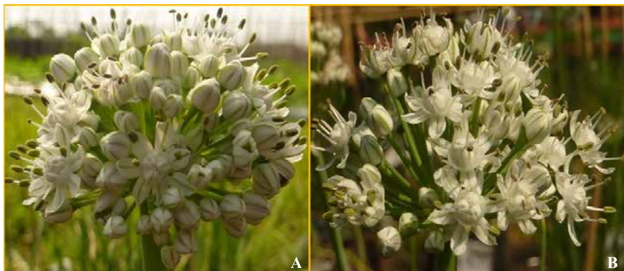
Gambar 2. Rerata jumlah bunga per umbel dari perlakuan BAP 100 ppm (A) lebih banyak daripada tanaman kontrol (B) ( Average of amount of floret per umbel from BAP treatment of 100 ppm(A), more than control plant (B) )

yaitu sekitar 89,9–105,0 bunga per umbel (Tabel 2 dan Gambar 2). Pengaruh positif BAP terhadap peningkatan produksi bunga kemungkinan disebabkan aktivitas sitokinin pada jaringan meristematik, yaitu meristem apikal bawang merah, seperti yang dijelaskan oleh Werner et al. (2001) pada peningkatan ukuran meristem tanaman Nicotiana tabacum dan Prat et al. (2008) pada perluasan zona meristematik tanaman jojoba yang menyebabkan peningkatan jumlah bunga karena peranan benziladenin atau benzilaminopurin.