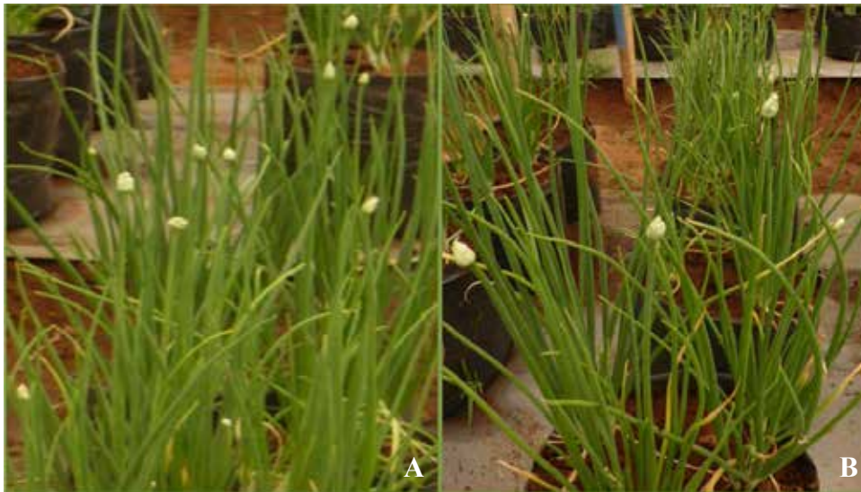
Gambar 1. Rerata jumlah umbel bawang merah dari perlakuan BAP (A) lebih banyak daripada tanaman kontrol (B) ( Average of amount of shallots umbel from BAP treatment (A), more than control plant (B) )

tn= tidak nyata/ns= non significant, HST (DAP) = Hari setelah tanam (Days after planting)