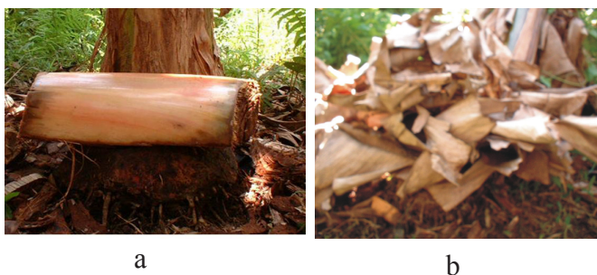
Gambar 1. Perangkap bonggol pisang yang digunakan untuk pengujian bahan carrier di lapangan (a) Perangkap ditutup dengan daun pisang kering untuk menghindari dari cahaya matahari (b) ( Corm and pseudostem trap which was used for examine carrier materials under field condition (a) Corm and pseudostem trap was covered by banana dry leaf to protect from the sunlight (b) )