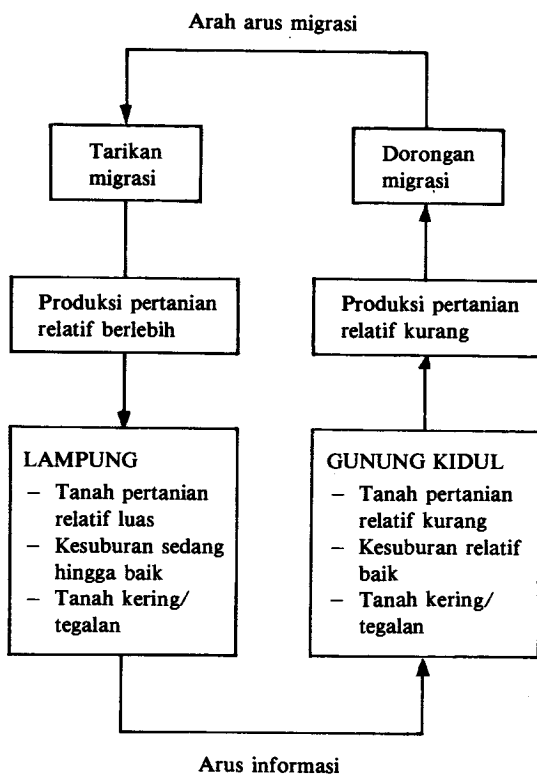
Gambar 2. Daya dorong dan daya tarik petani melakukan migrasi menetap desa - desa disebabkan faktor tanah pertanian.

transmigrasi spontan, antara lain ke Lampung. Alasan yang berhasil ditangkap, bahwa mereka terdesak untuk mencari kemungkinan cukup makan dan hidup yang lebih layak. Sebenarnya sejak 1930-an, dorongan bertransmigrasi ini sudah ada. Hanya saja, karena informasi daerah tujuannya belum memadai, hal ini baru terlaksana sepuluh tahun kemudian. Keberhasilan para transmigran spontan tersebut menjadi katalisator dan menambah keyakinan para petani generasi berikutnya untuk mengikuti jejak pendahulunya. Lebih-lebih para petani yang telah berhasil tersebut pada waktu tertentu, misalnya pada hari raya Idul Fitri, sering berkunjung ke saudara-saudaranya dan menceritakan keberhasilannya di daerah baru.