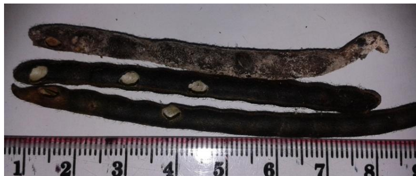
Gambar 2. Kerusakan yang ditimbulkan Larva M. testulalis pada polong kacang hijau

Kegiatan evaluasi kriteria ketahanan terhadap hama penggerek polong yang dilakukan adalah dengan menghitung besarnya presentase dari intensitas serangan pada polong dan biji kacang hijau. Hama penggerek polong ( M. testulalis ) merupakan hama utama pada tanaman kacang hijau yang dapat menimbulkan kerusakan pada polong dan biji sehingga menurunkan jumlah dan kualitas produksi (Mohamad, 2009). Polong yang diserang akan tampak berlubang bundar kecil (diemeter 1,0 – 2,0 mm) (Gambar 2).