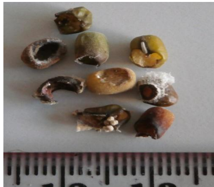
Gambar 3. Kerusakan pada biji kacang hijau oleh larva M. testulalis

Kerusakan yang ditimbulkan hama penggerek polong pada biji terlihat bahwa biji memiliki lubang ataupun keadaan biji sudah tidak lagi utuh (Gambar 3). Kerusakan diakibatkan oleh siklus hidup hama penggerek polong yang fase pupa terbentuk di dalam polong, sehingga ketika menetas menjadi larva, biji di dalam polong akan dimakan.