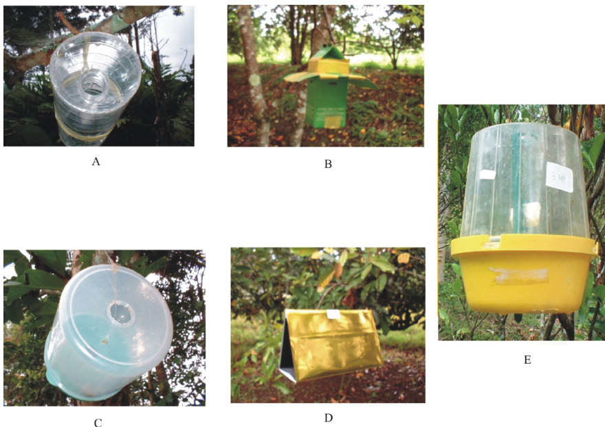
Gambar 1. Model perangkap untuk menangkap hama lalat buah yaitu (a) bekas botol air mineral, (b) modifikasi perangkap gypsy moth , (c) perangkap steiner, (d) perangkap delta transparan, (e) perangkap McPhail ( The traps type used for catching fruit flies (a) used bottle of mineral water, (b) the modified of gypsy moth trap, (c) the steiner trap, (d) transparent delta trap, and (e) McPhail trap. )

2. Penelitian tentang pengaruh ketinggian letak perangkap dilakukan di kebun Petani Kenagarian Kacang yang didominasi oleh jeruk kacang, nangka, jambu air, sawo (polikultur), dan di kebun tanaman markisa di Alahan Panjang (monokultur), Kabupaten Solok. Penelitian ditata dalam rancangan acak kelompok 6 perlakuan dan 4 ulangan. Macam perlakuan