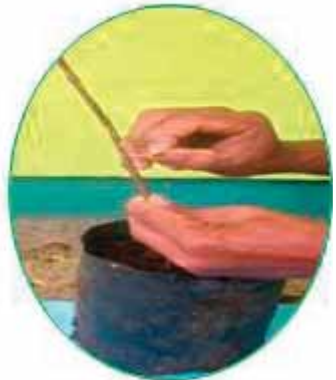
Gambar 5. Pengeratan batang bawah