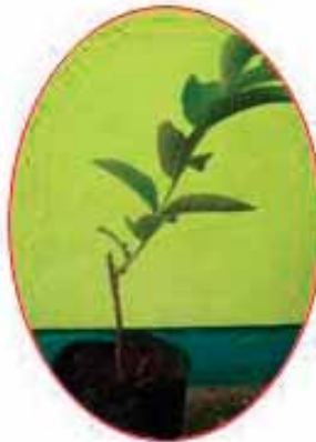
Gambar 10. Benih jambu biji hasil okulasi