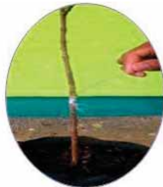
Gambar 8. Pengikatan mata tempel ke celah batang bawah dengan tali pengikat elastis