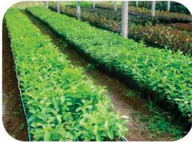
Gambar 3. Batang bawah jambu biji