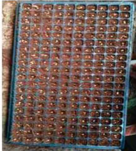
Gambar 1. Penyemaian Biji di kotak persemaian (tray)