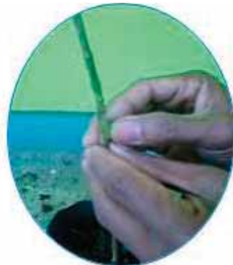
Gambar 7. Penempelan mata entres ke batang bawah