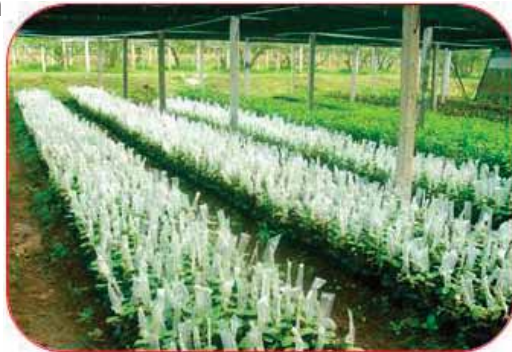
Gambar 4. Sambung pucuk jambu biji