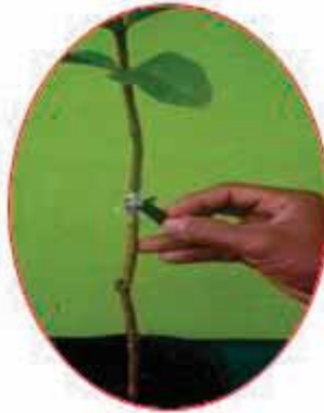
Gambar 9. Pembukaan ikatan okulasi