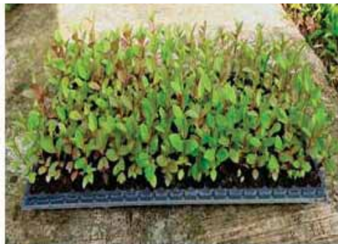
Gambar 2. Batang bawah jambu biji siap pindah ke polibag