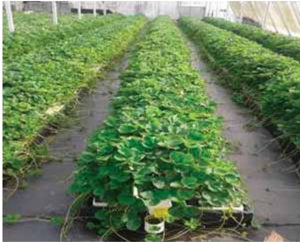
Gambar. 4. Produksi Benih Stroberi Skala Besar