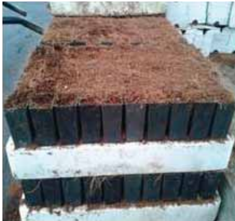
Gambar.2. Penyiapan media tanam,