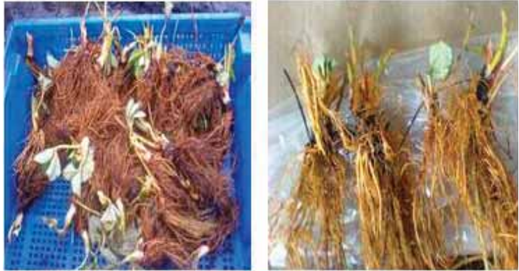
Gambar.1. Proses aklimatisasi (kurangi daun, batang/ranting yang telah menghitam dan perakaran tanaman)