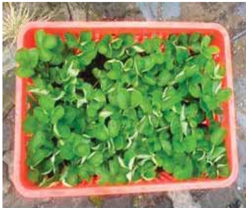
Gambar 5. Pengemasan Pengiriman Jarak Dekat