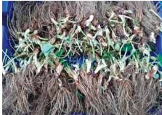
Gambar 6. Pembersihan akar dari media tanam