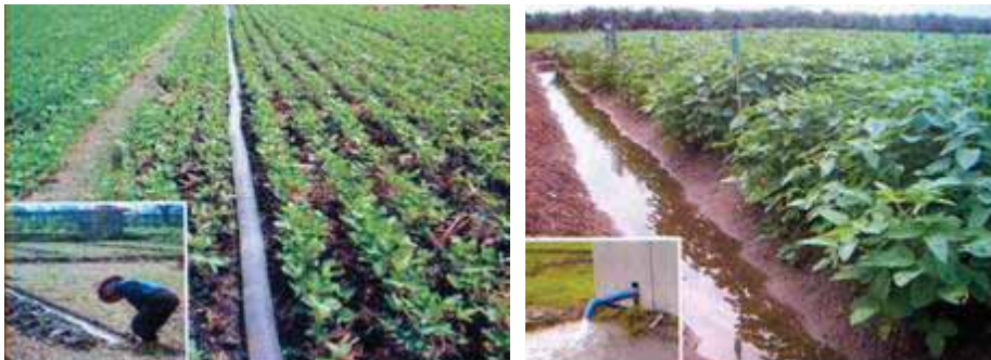
Gambar 3. Saluran drainase pada pertanaman kedelai

Saluran drainase diperlukan untuk mengalirkan air ke areal pertanaman guna menjaga kelembaban tanah agar pertumbuhan tanaman kedelai optimal.