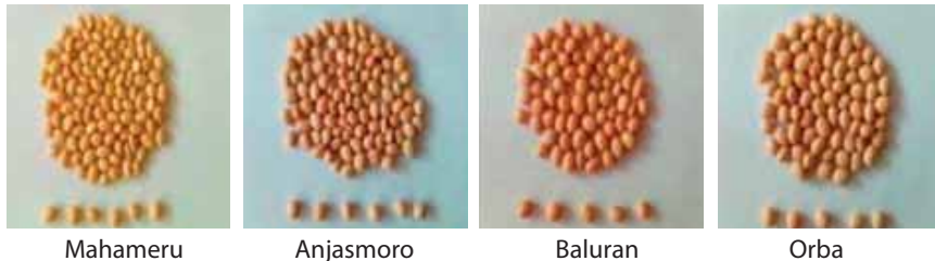
Gambar 1. Biji kedelai beberapa varietas

Setiap varietas memiliki daya adaptasi berbeda antar-agroekosistem, seperti lahan sawah/tegal, lahan masam, dan lahan pasang surut. Varietas Anjasmoro merupakan varietas unggul baru kedelai berbiji besar yang cocok digunakan sebagai bahan baku tempe. Kedelai berbiji besar umumnya diminati oleh industri tempe.