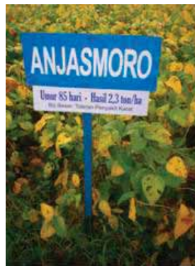
Gambar 2. Pertanaman Varietas Anjasmoro