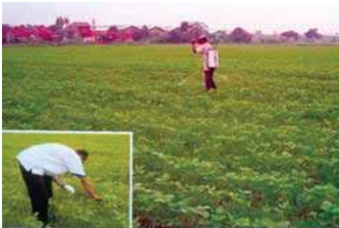
Gambar 5. Pengamatan dan pengendalian hama dan penyakit tanaman kedelai