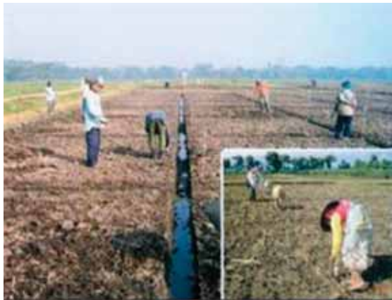
Gambar 4. Penanaman kedelai

Penanaman benih kedelai pada jarak tanam yang tepat akan menghasilkan populasi tanaman yang optimal bagi upaya peningkatan hasil kedelai.