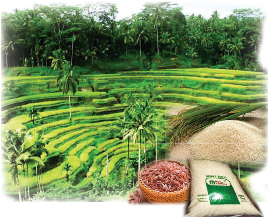
Gambar 1. Beras organik lebih sehat karena tidak menggunakan pupuk dan pestisida anorganik sehingga aman dan sehat untuk dikonsumsi

melestarikan lingkungan hidup, (2) beras organik lebih sehat karena tidak menggunakan pupuk dan pestisida anorganik sehingga aman dan sehat untuk dikonsumsi, dan (3) segmen pasar beras organik umumnya merupakan masyarakat kelas menengah ke atas sehingga harga jualnya lebih mahal.