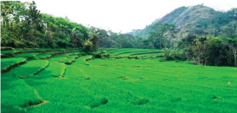
Gambar 5. Daerah yang cocok untuk pengembangan budidaya padi organik