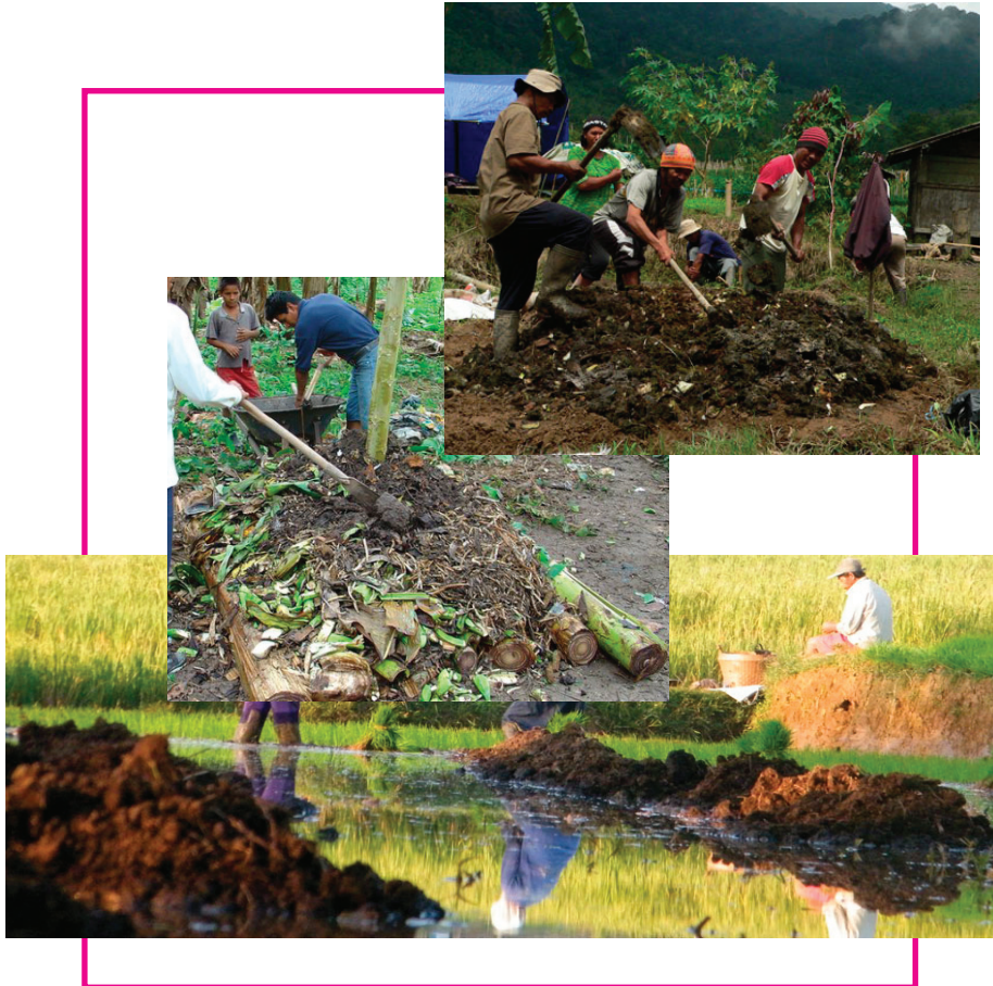
Gambar 2. Pengolahan pupuk organik untuk pemenuhan kebutuhan pupuk dasar budidaya padi organik

Pupuk organik yang digunakan berupa pupuk kandang atau kompos matang sebanyak 5 ton/ha. Pemberian dilakukan saat membajak sawah kedua dengan cara disebar merata keseluruh permukaan sawah.