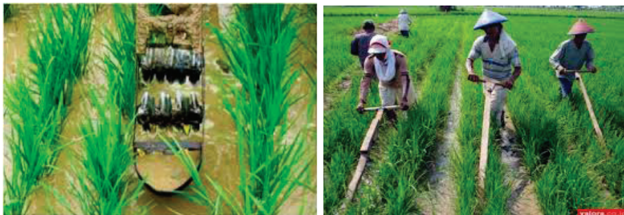
Gambar 3. Pengendalian Gulma menggunakan Alat Landakan atau Gasrok