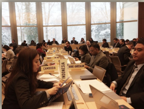
Delegasi RI menyampaikan posisi pada Sidkom SPS ke-71

F orum bertajuk “SPS Committee Meeting ” atau yang lebih dikenal dengan Sidang Komisi (Sidkom) Sanitary and Phytosanitary (SPS) yang ke-71 telah diselenggarakan tanggal 27 Februari - 3 Maret 2018 di Geneva, Switzerland. Sidkom SPS merupakan forum perundingan negara-negara anggota World Trade Organization (WTO) dalam hal perdagangan barang dari aspek perlindungan kesehatan hewan, tumbuhan, dan manusia. Forum ini berorientasi pada peningkatan transparansi, kepastian dan pemecahan isu perdagangan terkait SPS.