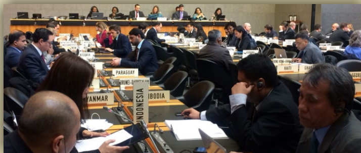
Suasana Sidkom SPS ke-71

Pada prinsipnya, proses diplomasi antara Indonesia dengan negara mitra dagang berjalan kondusif. Tanggapan atas isu hambatan dagang terkait isu SPS disampaikan oleh DELRI beserta PTRI guna mendapatkan perkembangan posisi. Hal yang penting adalah memberi pemahaman kepada negara mitra dagang akan prinsip dan justifikasi ilmiah yang menjadi dasar diberlakukannya sebuah aturan, serta perlu dilakukan update informasi yang baik antar K/L terkait guna memperkuat posisi SPS Indonesia. (UK)