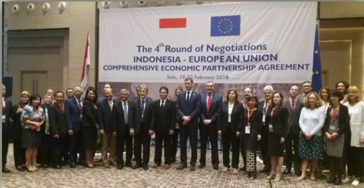
Photo Session Peserta Perundingan IEU-CEPA Putaran ke-4