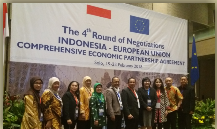
Delegasi RI untuk Working Group SPS

Secara umum Working Group on SPS IEU-CEPA merupakan salah satu wujud keseriusan kedua Pihak yang berupaya untuk lebih meningkatkan perdagangan bilateral dengan prinsip saling menguntungkan ( win win solution ). Kedua negara berkomitmen agar perundingan IEU-CEPA dapat menghasilkan perjanjian perdagangan yang memberikan manfaat bagi kedua Pihak. (UK)