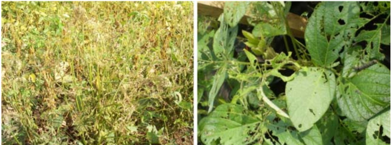
Gambar 1. Gejala kerusakan daun kedelai akibat serangan ulat grayak.