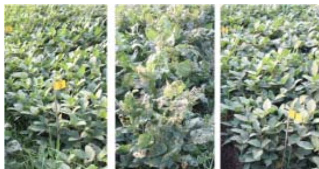
Gambar 5. Tingkat serangan ulat grayak pada daun galur harapan kedelai hasil persilangan IAC 100 dengan Kaba dan pada varietas Anjasmoro di Pasuruan.

antixenosis kedelai terhadap hama ulat grayak mempunyai nilai heritabilitas arti luas yang tinggi (73,2%) (Komatsu et al. 2004). Artinya, karakter ketahanan antixenosis tersebut mempunyai peluang yang cukup tinggi untuk diwariskan.