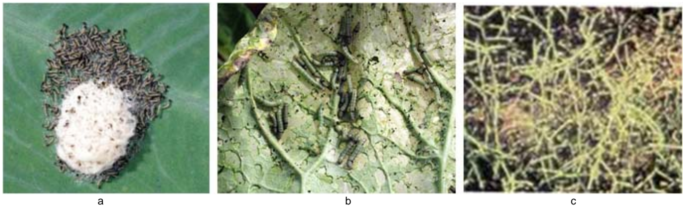
Gambar 2. Telur yang baru menetas (a), larva instar 1 (b), dan serangan parah pada daun (c).