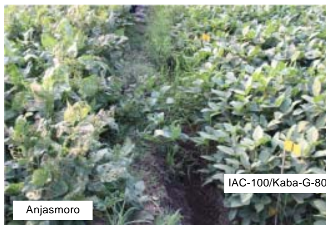
Gambar 4. Tingkat serangan ulat grayak pada daun varietas Anjasmoro dan galur harapan kedelai toleran ulat grayak (IAC 100/Kaba-G-80) di Pasuruan.

Ketahanan kedelai terhadap ulat grayak mengikuti ketahanan antibiosis dan antixenosis. Ketahanan