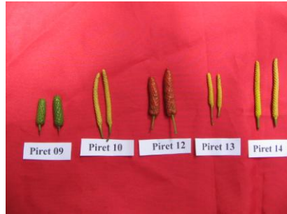
Gambar 2. Variasi bentuk dan warna buah 5 aksesori plasma nutfah cabe jawa di KP. Cikampek

berubah putih, dan berubah lagi menjadi hijau kemudian berwarna kuning kemerahan pada saat siap dipetik (Haryudin dan Rostiana 2009).