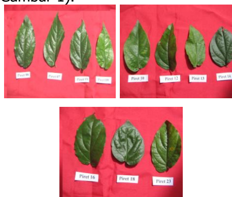
Gambar 1. Variasi karakter morfologi daun cabe jawa yang dikoleksi di KP. Cikampek

panjang dan lebarnya meningkat, membentuk daun oval. Hal ini menunjukkan terjadinya interaksi antara sifat genetik tanaman dan lingkungan tempat tumbuh yang baru selama proses adaptasi (Finlay dan Wilkinson 1993), yang tereksresi dalam perubahan bentuk daun. Begitu juga pada tanaman jarak pagar mempunyai keragaman genetik yang tinggi, keragaman yang tinggi berinteraksi dengan faktor lingkungan sehingga kemampuan masing-masing genotipe berbeda-beda dalam menghasilkan buah (Wardiana dan D. Pramono 2010) (Gambar 1).