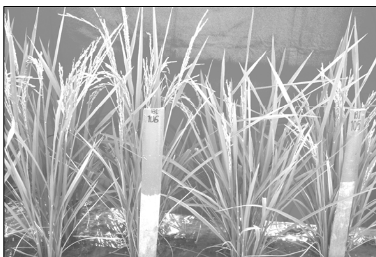
Gambar 2. Perbedaan tinggi dan kecepatan berbunga antara galur DH pelestari (No. 106, kiri) dengan galur mandul jantan yang dilestarikannya (No. 105, kanan).

125,33 cm. Sepuluh galur yang mempunyai tinggi tanaman kurang dari 110 cm antara lain BioMAc 18-H36-3-Ma, BioMAc19-H36-3-Mb, BioMAc20-H36-3-Mc, BioMAc21-H36-4-M, BioMAc26-B1-1-Mb, BioMAc29-B2-1-Db, BioMAc31-B2-1-M, BioMAc33-B2-4-Pb, BioMAc34-B4-1-Da, dan BioMAc35-B4-1-Dc. Sepuluh galur tersebut selain memiliki tinggi tanaman yang sesuai juga mempunyai jumlah anakan yang sedang, yaitu berkisar dari 9 hingga 13 anakan (Tabel 2).