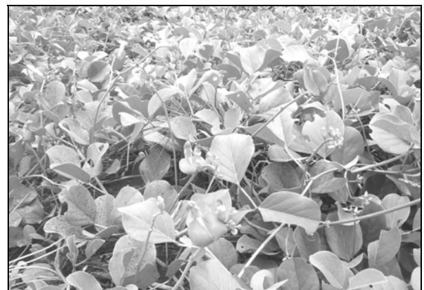
Gambar 1. Tanaman kerandang.

Produksi biji kerandang, batang, dan daun, kulit polong serta kulit biji disajikan pada Tabel 2. Hasil pengamatan ubinan seluas 100 m 2 kemudian dikonversikan dalam hektar dikurangi tingkat kesalahan luas sebesar 11%. Produksi biji kerandang se-