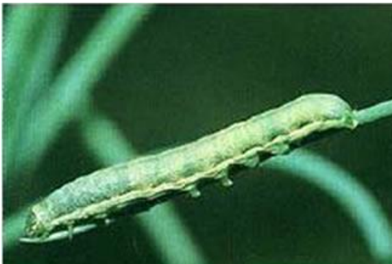
Gambar 6. Larva S. exigua

Pupa berwarna coklat muda, berukuran panjang 15-20 mm, terletak pada kedalaman 1,1-2 cm. Pada kedalaman tersebut suhu tanah hangat dan memudahkan kemunculan imago. Periode pupa berlangsung selama 6-7 hari pada kondisi suhu hangat (Zheng dkk. 2011; Capinera 2017). Rata-rata daur hidupnya pada bawang merah 9-