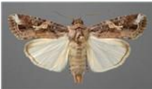
Gambar 11. Imago S. frugiperda

Ngengat jantan mempunyai sayap depan berwarna abu-abu dan coklat dengan spot putih pada ujung dan dekat pusat sayap. Sayap depan ngengat betina coklat keabu-abuan polos hingga berbintik abu-abu dan coklat. Sayap mempunyai bentangan sepanjang 32-40 mm. Ngengat mampu menghasilkan 1000 butir telur selama hidupnya (Kebede & Shimalis 2019; Rwomushana 2019).