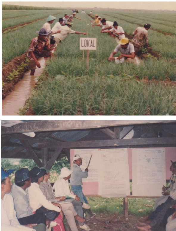
Gambar 29. Sekolah Lapangan – Pengelolaan Hama Terpadu (SL-PHT) pada budidaya bawang merah untuk menekan serangan ulat grayak eksigua di Brebes, Jawa Tengah yang diselenggarakan oleh Prognas PHT-Bappenas pada tahun 1992-1995

selanjutnya pada tanaman sayuran. Pelatihan PHT diselenggarakan secara nasional untuk mencetak para pemandu dan pengamat OPT yang handal. Selanjutnya para pemandu tersebut menjadi fasilitator pada sekolah lapangan (SL) PHT bagi petani yang dilaksanakan di seluruh Indonesia. Terbitnya UU No. 12 tahun 1992 tentang Sistem Perlindungan Tanaman serta PP No. 6 tahun 1995 tentang Perlindungan Tanaman merupakan komitmen pemerintah untuk menerapkan PHT.