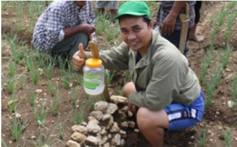
Gambar 23. Perangkap Feromon Exi pada tanaman bawang merah di Enrekang