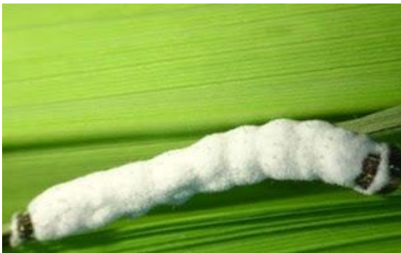
Gambar 15. Larva S. frugiperda yang terserang oleh cendawan B. bassiana

Cendawan entomopatogen yang dilaporkan menyerang Spodoptera spp. ialah Metarhizium anisopliae , Metarhizium rileyi dan Beauveria bassiana . Mortalitas telur dan larva yang terserang oleh M. anisopliae masing-masing mencapai 97,5% dan 79,5% - 86,67% (Aryo dkk. 2017; Nurani dkk. 2018; Akutse dkk. 2019).