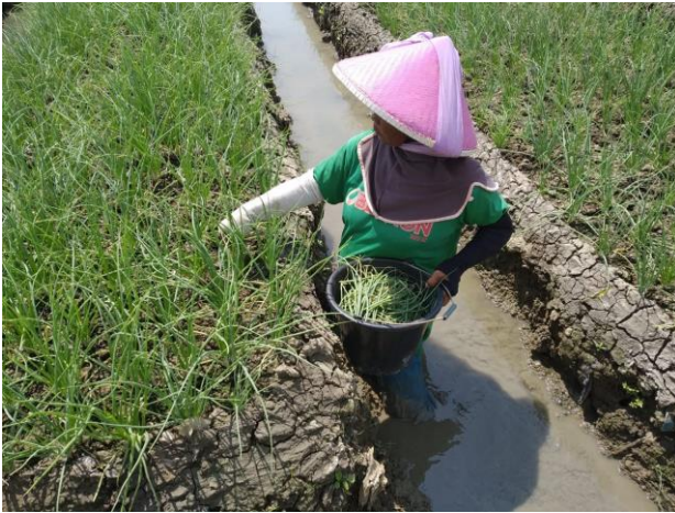
Gambar 19. Pengendalian mekanik dengan cara mengumpulkan kelompok telur, larva dan daun-daun yang terserang oleh Spodoptera spp.

Pada budidaya tanaman bawang merah pengendalian secara mekanik telah umum dilakukan oleh petani, yaitu dengan cara mengumpulkan kelompok telur, ulat Spodoptera spp. dan daun-daun bawang yang terserang. Petani bawang merah di Kabupaten Cirebon, Jawa Barat pada umumnya melakukan pengendalian secara mekanik 1 sampai 2 kali per minggu sejak tanaman bawang merah umur 7 hari sampai menjelang panen (Moekasan dkk. 2018).