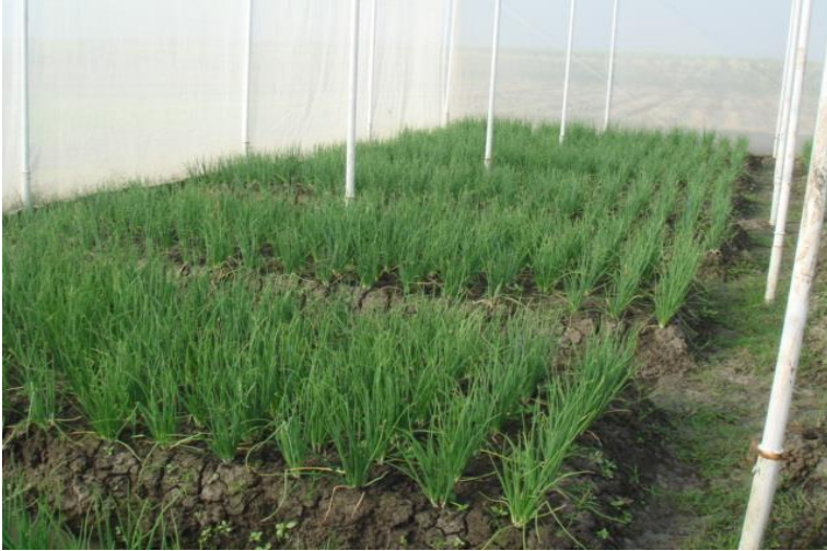
Gambar 22. Budidaya bawang merah di dalam rumah kaca untuk menekan serangan hama Spodoptera spp. di dataran rendah di Cirebon, Jawa Barat