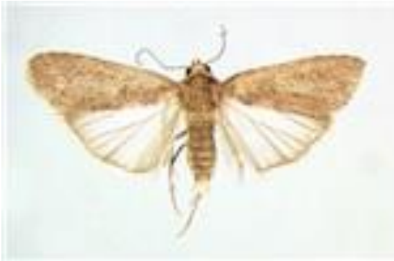
Gambar 4. Imago S. exigua

Seekor ngengat betina mampu meletakkan 10 kelompok telur, yang masing-masing terdiri atas 30-140 butir. Telur diletakkan dalam kelompok berbentuk oval, berwarna putih dan ditutupi oleh selaput (Kalshoven 1980).