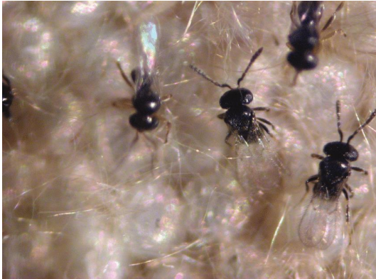
Gambar 14. Telenomus remus pada telur S. litura

Cotesia scotti dan Apanteles sp. juga dilaporkan oleh deFreitas dkk. (2019) dan Schmidt-Duran dkk. (2015).