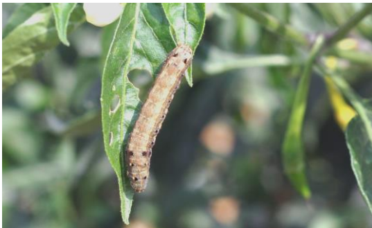
Gambar 2. Larva S. litura

Larva muda berwarna hijau dengan toraks dan kepala hitam. Selanjutnya warna larva bervariasi dan mempunyai pola berwarna merah dan kuning dengan garis hijau dan spot hitam sepanjang sisi samping abdomen. Juga terdapat noktah hitam di belakang kepala. Larva tua coklat tua dengan tiga garis tipis berwarna kuning atau jingga muda sepanjang tubuhnya. Selain itu terdapat noktah hitam berbentuk setengah lingkaran pada setiap ruas abdomen. Larva instar terakhir berukuran panjang 50 mm atau lebih (Northern Territory Government 2020). Periode larva berlangsung rata-rata selama 15,6 hari pada tanaman jarak (Kalshoven 1980). Hasil penelitian Ramaiah & Maheswari (2018) menunjukkan bahwa pada tanaman jarak, larva S. litura terdiri atas lima instar, sementara Fattah & Ilyas (2016) melaporkan pada kedelai dapat mencapai enam instar.