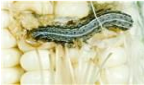
Gambar 10. Larva S. frugiperda

stadia pupa 8-9 hari pada musim panas dan 20-30 hari pada musim dingin (Kebede & Shimalis 2019).