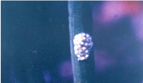
Gambar 5. Kelompok telur S. exigua

lateral gelap. Warna larva instar ke-5 bervariasi, tetapi cenderung berwarna hijau pada bagian dorsal dengan warna putih atau kuning pada bagian ventral dan garis putih pada bagian lateral. Sederet spot hitam ada pada bagian dorsal dan dorsolateral. Tubuhnya hampir tanpa bulu.