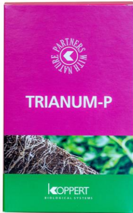
Gambar 27. Biofungisida yang mengandung Trichoderma harzianum T-22 untuk mengendalikan penyakit tular tanah seperti Pythium spp., Rhizoctonia spp., Fusarium spp. dan Sclerotinia .