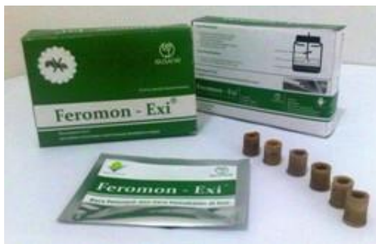
Gambar 21. Kapsul Feromon-Exi untuk mengendalikan hama S. exigua

Feromonoid seks juga digunakan dalam pengendalian S. frugiperda . Pemasangan 4-6 perangkap feromonoid seks per hektar, yang dikombinasikan dengan teknologi pengendalian lainnya, mampu menekan serangan ulat grayak jagung (Kebede & Shimalis 2019).