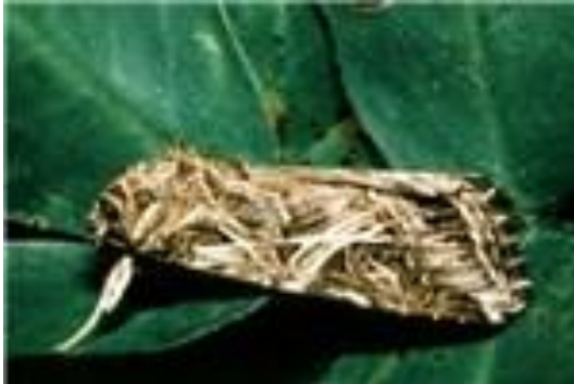
Gambar 3. Ngengat S. litura

mampu menghasilkan 2000-3000 butir telur sepanjang hidupnya (Kalshoven 1980).