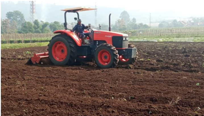
Gambar 12. Pengolahan tanah yang baik dan dalam dapat membunuh pupa Spodoptera spp.

daun telah dilakukan oleh 54% petani jagung di Ethiopia (Assefa dkk. 2019). Purnamaratih dkk. (2018) melaporkan bahwa tumpangsari tanaman bawang merah dengan mint dan seledri mampu menurunkan serangan ulat grayak eksigua. Penggunaan mulsa jerami pada budidaya bawang merah di Lembah Palu dapat menurunkan intensitas serangan ulat grayak eksigua sebesar 20,83% (Valentino & Thaha 2019). Pengolahan tanah yang baik serta penggunaan tanaman perangkap Leguminosae digunakan untuk menanggulangi serangan ulat grayak jagung di Nepal (Bhusal & Chapagain 2020).