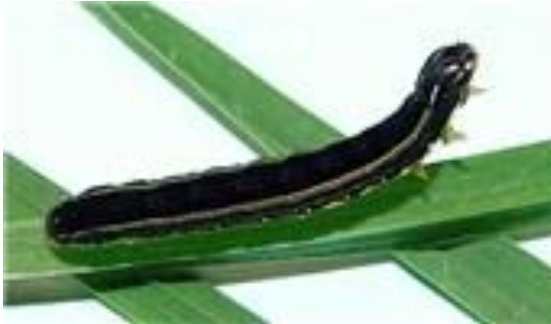
Gambar 7. Larva S.exempta

Ngengat berukuran paanjang 14-18 mm. Abdomen ditutupi dengan sisik abu-abu coklat kecuali ujung abdomen betina yang sisiknya hitam, yang merupakan ciri spesies ini. Bentangan sayap sepanjang 29-34 mm. Sayap depan berwarna coklat tua dengan tanda-tanda kelabu hitam. Daur hidupnya sekitar 25 hari (Kalshoven 1980).