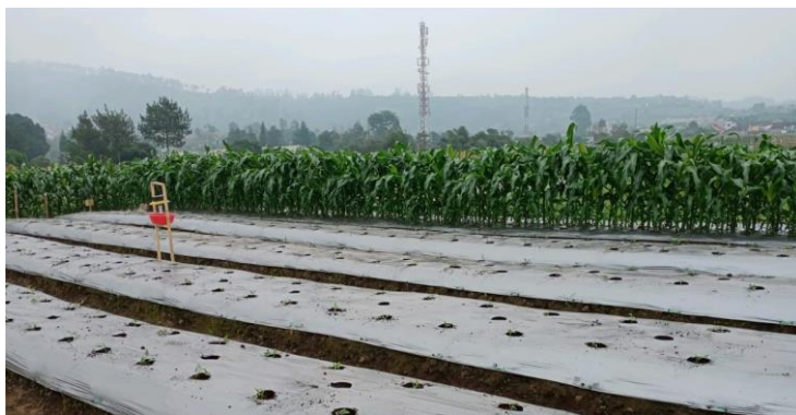
Gambar 13. Penggunaan mulsa plastik hitam perak untuk menekan serangan ulat grayak

Teknologi push-pull agricultural pest management telah diterapkan untuk mengendalikan ulat grayak jagung S. frugiperda di Kenya, Uganda dan Tanzania, Afrika. Hasilnya menunjukkan bahwa populasi ulat grayak jagung ditekan sebesar 82,7% dan kerusakan tanaman jagung dikurangi sebesar 89,7% (Kebede & Shimalis 2019).