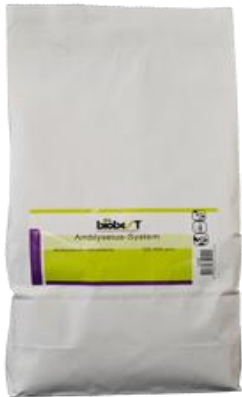
Gambar 28. Kantung kertas yang berisi 125.000 predator mite ( Amblyseius cucumeris ) untuk mengendalikan hama trips produksi BioBest