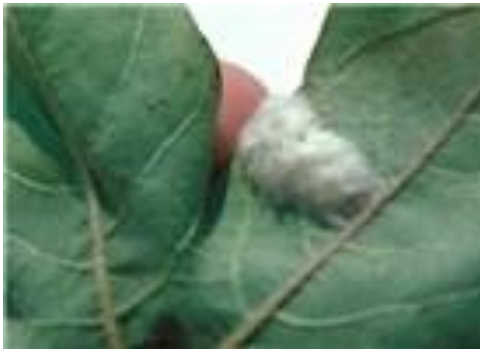
Gambar 9. Kelompok telur S. frugiperda

Telur berdiameter 0,4 mm dan tinggi 0,3 mm, berwarna kuning pucat dan menjadi coklat muda ketika menjelang menetas. Umur telur 2-3 hari pada suhu 20 °C – 30 °C. Telur diletakkan dalam kelompok yang terdiri atas 100-200 butir (Prasanna dkk. 2018).