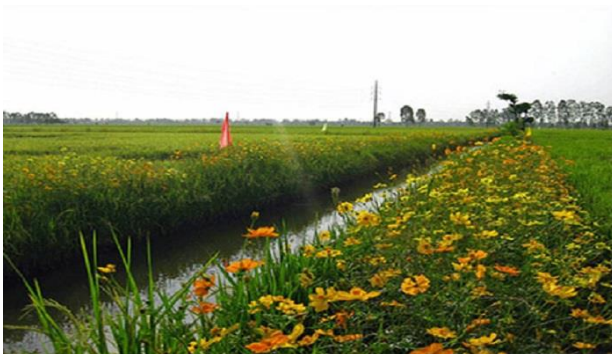
Gambar 25. Tanaman refugia yang ditanam di pinggiran pesawahan untuk tempat tinggalnya musuh alami

Penelitian penggunaan parasitoid sudah banyak dan terbukti efektif (Sari dkk. 2020; Supeno dkk. 2021). Namun, musuh alami tersebut belum diproduksi secara massal sehingga petani belum dapat menerapkan teknologi tersebut. Hal yang dapat dilakukan oleh petugas lapangan ialah memberikan edukasi mengenai penanaman refugia di sekitar pertanaman utama, yang berfungsi sebagai tempat berkembang biaknya kedua jenis musuh alami tersebut. Dengan demikian, parasitoid dan predator di lapangan selalu tersedia sehingga diharapkan mampu mengendalikan populasi Spodoptera spp. hingga di bawah ambang pengendalian (Sitepu 2018; Sumini & Bahri 2020).