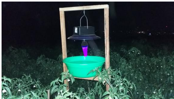
Gambar 24. Penggunaan perangkap lampu untuk menekan serangan hama Spodoptera spp. pada budidaya cabai di Garut, Jawa Barat

Penggunaan perangkap lampu di Jenepono, Sulawesi Selatan mampu menekan serangan ulat grayak eksigua sehingga aplikasi insektisida berkurang sebesar 85,3% dan budidaya bawang merah tersebut menguntungkan dengan R/C rasio sebesar 2,07 (Nurjanani & Ramlan 2008).