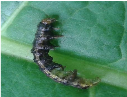
Gambar 20. Larva S. litura yang terserang oleh B. thuringiensis

Mikroba berupa bakteri, jamur, dan virus telah dimanfaatkan sebagai bahan aktif insektisida. Jenis insektisida tersebut memiliki risiko rendah dalam pengendalian hama (Bateman dkk. 2018). Nomuraea rileyi 1% WP dan Bacillus thuringiensis var kurstaki 1% WG digunakan untuk mengendalikan ulat grayak jagung (Dhobi dkk. 2020). Insektisida berbahan aktif spinosad dan spinetoram, yang berasal dari bakteri Saccharopolyspora spinosa telah digunakan untuk mengendalikan larva lepidoptera (Siegwart dkk. 2015; deCastro dkk. 2018).