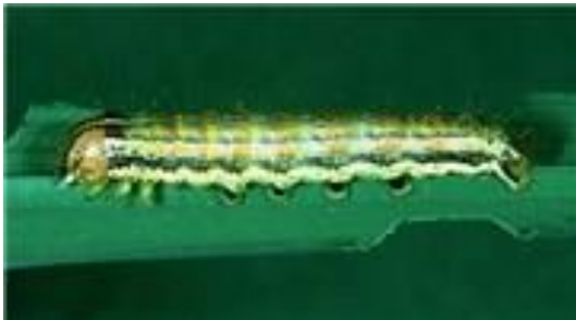
Gambar 8. Larva S.mauritia

Larva biasanya menetas pada pagi hari, sangat aktif menggaruk epidermis daun mulai dari ujung daun. Larva muda berwarna hijau muda dengan garis-garis pada pinggir dan punggung yang berwarna putih kekuningan. Selanjutnya warna larva menjadi coklat keabu-abuan dengan spot hitam pada setiap sisi segmen tubuhnya. Jika diganggu, tubuh larva melingkar, seperti karakteristik ulat tanah dan ulat grayak pada umumnya (Tanwar dkk. 2010).