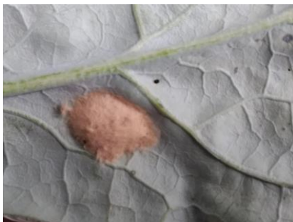
Gambar 1. Kelompok telur S. litura

Telur berbentuk lonjong, kadang agak pipih, berdiameter 0,6 mm dan diletakkan dalam kelompok yang terdiri atas ratusan butir, ditutupi oleh sisik mirip rambut-rambut berwarna coklat muda (Kalshoven 1980). Seekor ngengat betina mampu menghasilkan 2000-3000 butir telur sepanjang hidupnya (Kalshoven 1980). Serangga ini berkembang baik pada kisaran suhu 26 – 35,1 °C dan kelembaban 62-89% (Selvaraj dkk. 2010).