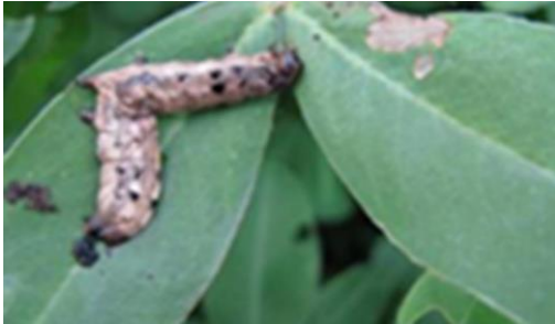
Gambar 16. Larva S.litura yang terserang oleh NPV

100%. Hasil penelitian Sarwar dkk. (2021) menunjukkan bahwa kombinasi NPV dengan insektisida khlorantraniliprol efektif membunuh telur, larva, pupa dan ngengat S. litura .