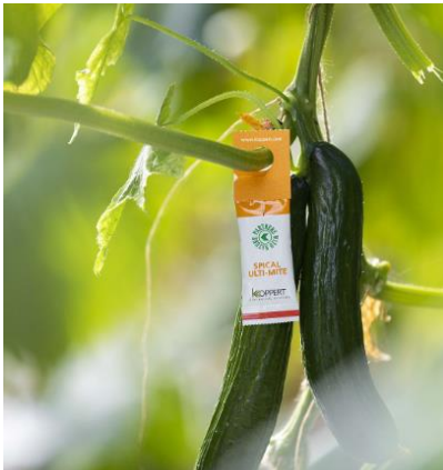
Gambar 26. Sachet "Spical Ulti-Mite" yang berisi predator mite Neoseiulus californicus untuk mengendalikan tungau pada tanaman sayuran, hias, dan buah

Teknologi pengendalian Spodoptera spp. dengan memanfaatkan parasitoid dan predator lokal Indonesia masih perlu dikembangkan lebih lanjut. Teknologi produksinya secara massal, pengemasannya dan aplikasinya di lapangan masih harus dikaji secara mendalam sebelum dapat dengan mudah digunakan oleh petani. Di negara maju seperti di Belanda, parasitoid, predator dan patogen telah diproduksi oleh suatu perusahaan seperti Koppert dan Biobest dan dikemas secara baik dalam botol atau sachet sehingga petani mudah mengaplikasikannya.