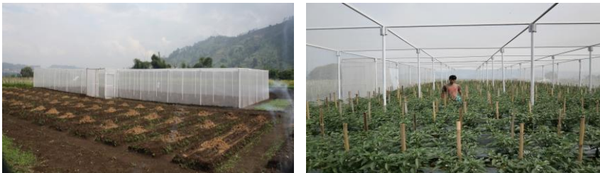
Gambar 18. Penggunaan rumah untuk menekan serangan hama Spodoptera spp. pada budidaya cabai

Budidaya tanaman di dalam rumah kaca merupakan alternatif penekanan penggunaan pestisida yang cukup efektif. Hal itu telah dibuktikan oleh Moekasan & Prabaningrum (2013) yang melaporkan bahwa rumah kaca mampu menghalangi ngengat S. litura dan S. exigua masuk ke pertanaman bawang merah sehingga aplikasi insektisida dikurangi sebesar 92,86%-100%. Selain itu, penekanan jumlah penyemprotan insektisida sebesar 73,33% juga terjadi pada budidaya cabai di dalam rumah kaca karena telah mengurangi serangan hama, termasuk ulat grayak (Moekasan dkk. 2015).