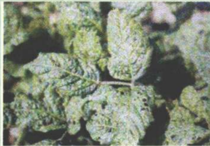
Gambar 3. Daun terserang SMV