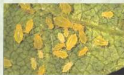
Gambar 6. Aphis glycines , vektor penyakit virus mosaik