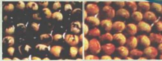
Gambar 4. Biji terserang SMV

Tanaman yang terserang tulang daun muda menjadi kurang jernih. Selanjutnya daun berkerut dan mempunyai gambaran mosaik dengan warna hijau gelap di sepanjang tulang daun. Tepi daun sering mengalami klorosis. Tanaman terinfeksi SMV ukuran biji mengecil dan jumlah biji berkurang sehingga hasil biji turun. Bila penularan virus terjadi pada tanaman muda, penurunan hasil berkisar antara 50-90%. Penurunan hasil sampai 93% telah dilaporkan pada lahan percobaan yang dilakukan inokulasi virus mosaik kedelai.