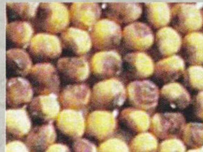
Gambar 2. Gejala serangan C. kikuchii pada biji