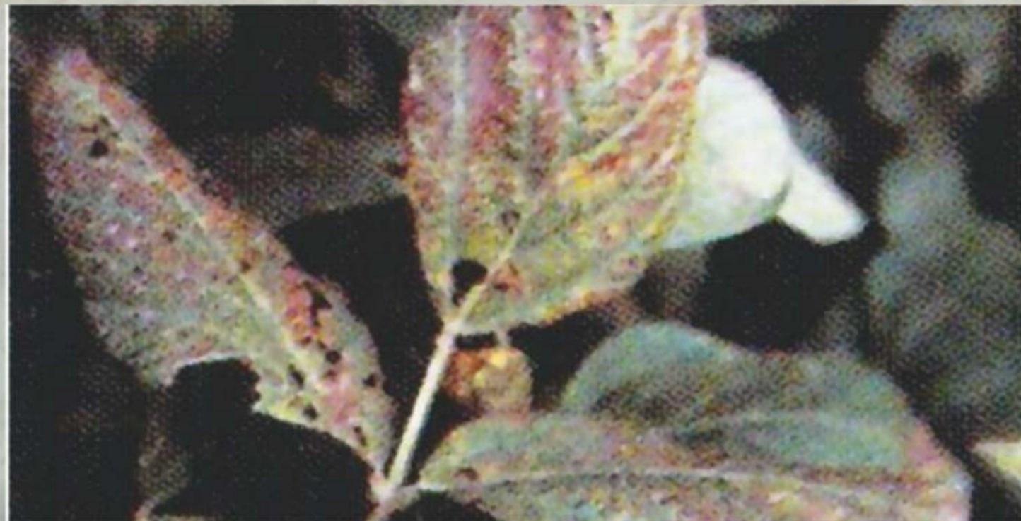
Gambar 1. Gejala serangan C. kikuchii pada daun

Gejala pada daun, batang dan polong sulit dikenali, sehingga pada polong yang normal mungkin bijinya sudah terinfeksi. Gejala awal pada daun timbul saat pengisian biji dengan kenampakan warna ungu muda yang selanjutnya menjadi kasar, kaku dan berwarna ungu kemerahan. Bercak berbentuk menyudut sampai tidak beraturan dengan ukuran yang beragam dari sebuah titik sebesar jarum sampai 10 mm dan menyatu menjadi bercak yang lebih besar. Gejala mudah diamati pada biji yang terserang yaitu timbul bercak berwarna ungu. Biji mengalami diskolorasi dengan warna yang bervariasi dari merah muda atau ungu pucat sampai ungu tua dan berbentuk titik sampai tidak beraturan dan membesar.