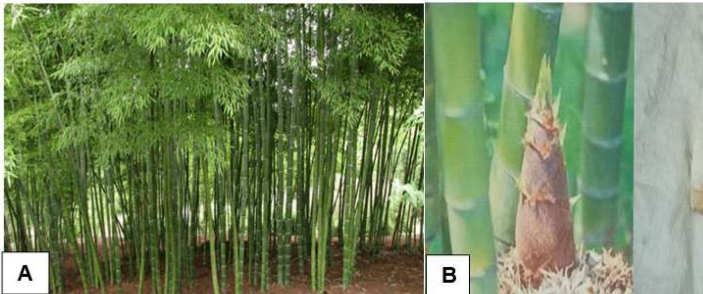
Gambar 2. Tanaman bambu (A) dan Tunas/Anakan bambu/rebung (B) (Sumber Gambar dari Goegle)

Pohon bambu ( Bambusa sp ) banyak tumbuh didesa terutama di perkampungan dimana masyarakat lokal sudah hidup lama (puluhan sampai ratusan tahun) khususnya banyak tumbuh dipinggir sungai. Bambu merupakan tanaman jenis rumput-rumputan, tumbuhnya sangat cepat dan memiliki rongga serta ruas dibatangnya, dan memiliki banyak nama diantaranya adalah buluh, aur, dan eru. Anakan/tunas bambu muda yang dikenal dengan “rebung” namanya (Gambar 2), biasanya oleh masyarakat digunakan sebagai bahan bumbu masakan atau dijadikan sayur. Padahal anak bambu tersebut dapat dimanfaatkan sebagai bahan baku pembuatan MOL. MOL berbahan baku anak bambu (rebung) seperti MOL dari bahan baku lainnya fungsi dan manfaatnya sama saja. Oleh karena itu, rebung bambu selain digunakan sebagai bumbu masakan/sayur, bagian lainnya yang tidak digunakan dapat dijadikan sebagai bahan baku MOL sehingga semua bagian rebung ini dapat dimanfaatkan secara maksimal.