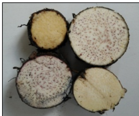
Gambar 3. Bentuk penampakan melintang cormus talas Upe Ungu dan Upe Kuning.