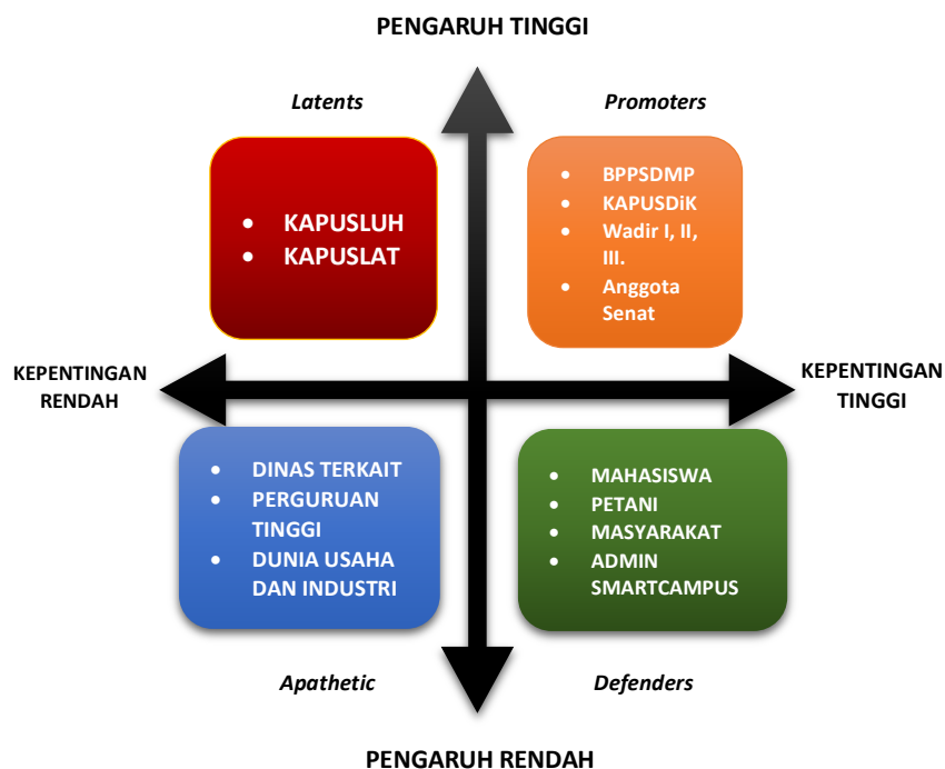
Gambar 3. Kuadran Stakeholder (Implementasi proyek perubahan).

Terjadi perubahan Peta/kuadran stakeholder pada saat rancangan proyek dan pada saat implementasi proyek perubahan, perubahan disebabkan karena adanya dukungan baik dari Wakil Direktur I, II, III serta dukungan dari admin Smartcampus. Perubahan Kuadran stakeholder saat implementasi dapat dilihat pada Gambar 2.