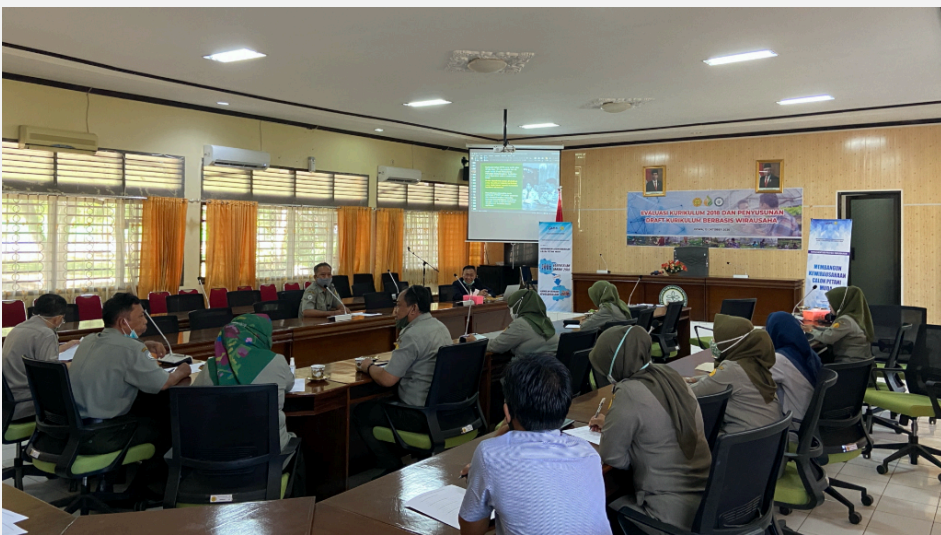
Gambar 7. Kerja Tim Efektif