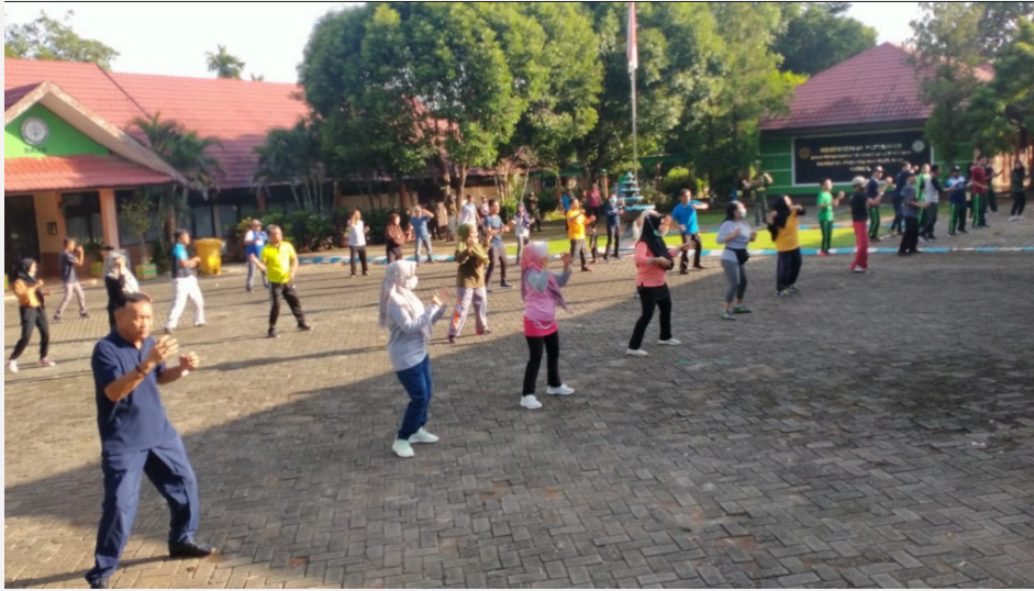
Gambar 6. Senam Kesegaran Jasmani dan Rohani