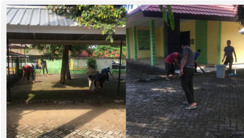
Gambar 5. Kegiatan Jumat Bersih