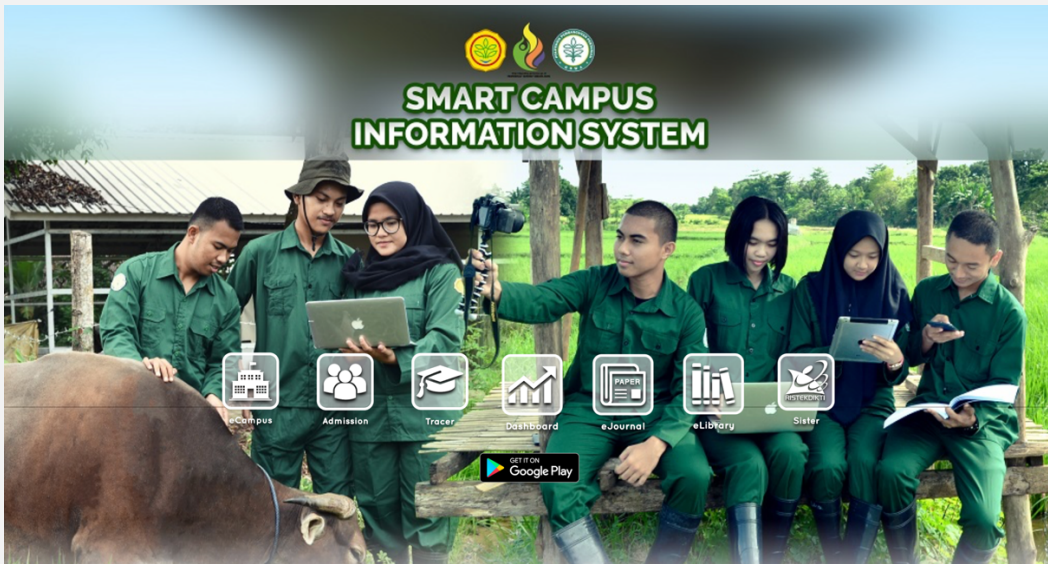
Gambar 10. Operasionalisasi Teknologi Informasi