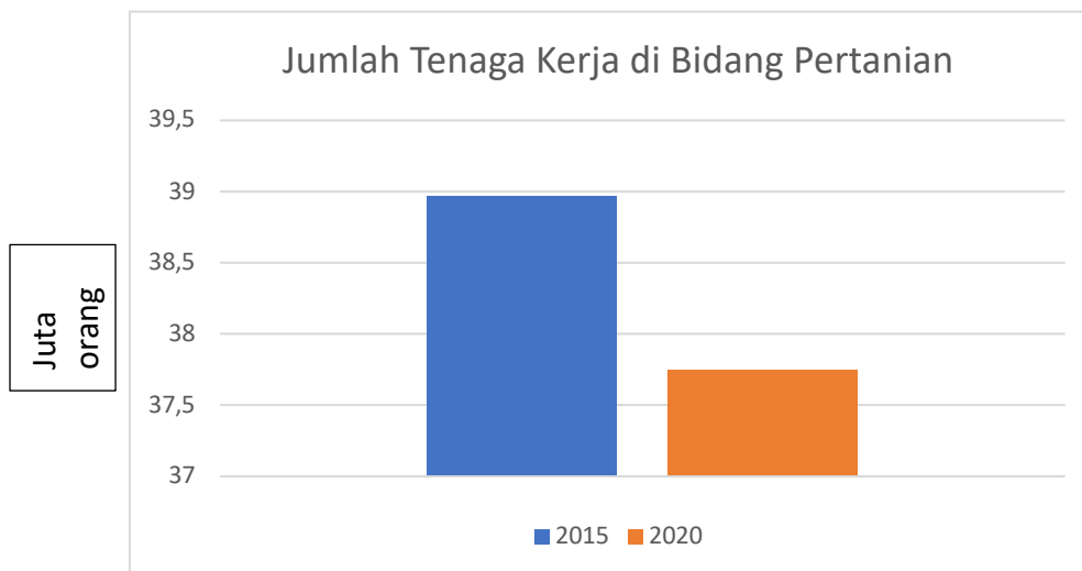
Gambar 1. Hubungan antara Jumlah tenaga kerja dengan tahun

Sektor pertanian masih menjadi primadona bagi masyarakat Indonesia, dimana sebagian besar masyarakat masih mengandalkan pertanian sebagai mata pencaharian mereka. Data BPS (2015), menunjukkan bahwa jumlah tenaga kerja di sektor pertanian menurun sebesar 3,13 persen, mengalami penurunan dari 38,97 juta orang menjadi 37,75 juta orang. Menurut Kementerian Pertanian (2015), penurunan ini merupakan hal yang wajar dan alamiah ketika sektor lain mengalami kemajuan. Masyarakat golongan usia muda (18-40 tahun) lebih memilih sektor perdagangan dan jasa dibandingkan sektor pertanian. Masyarakat yang berusia diatas 40 tahun biasanya masih memilih pertanian sebagai mata pencaharian utama mereka sehingga masih bertahan sebagai petani.