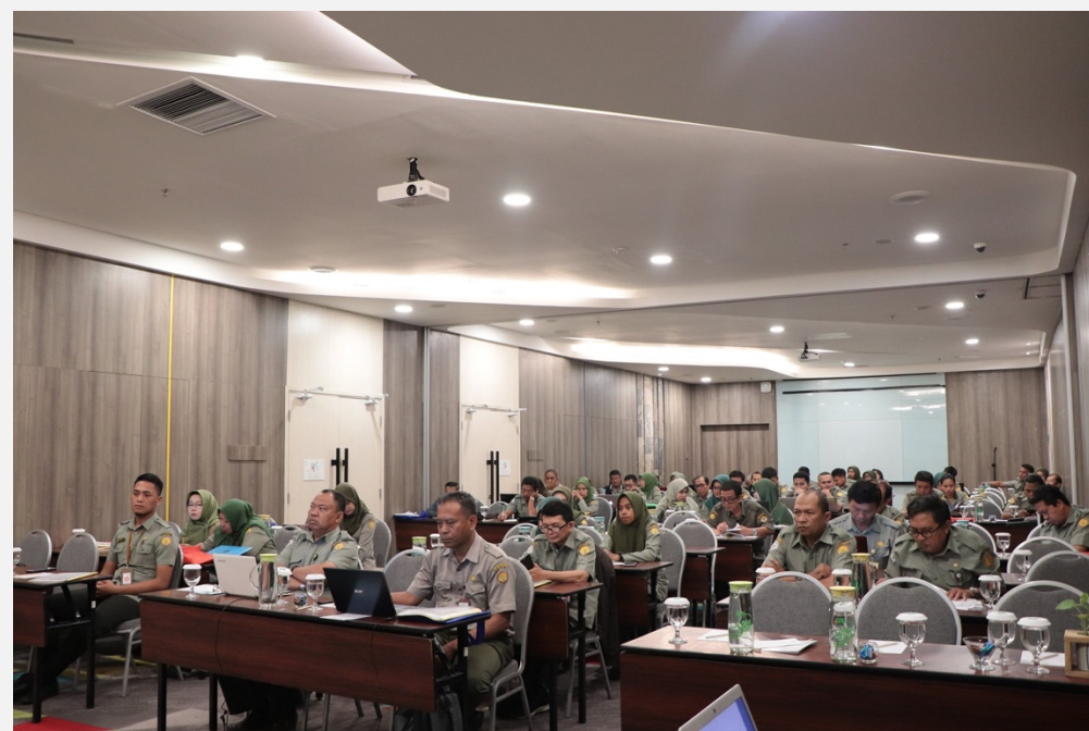
Gambar 9. Pengembangan Sumberdaya Manusia