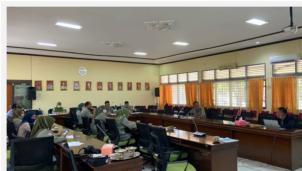
Gambar 8. Transfer Ilmu Pengetahuan