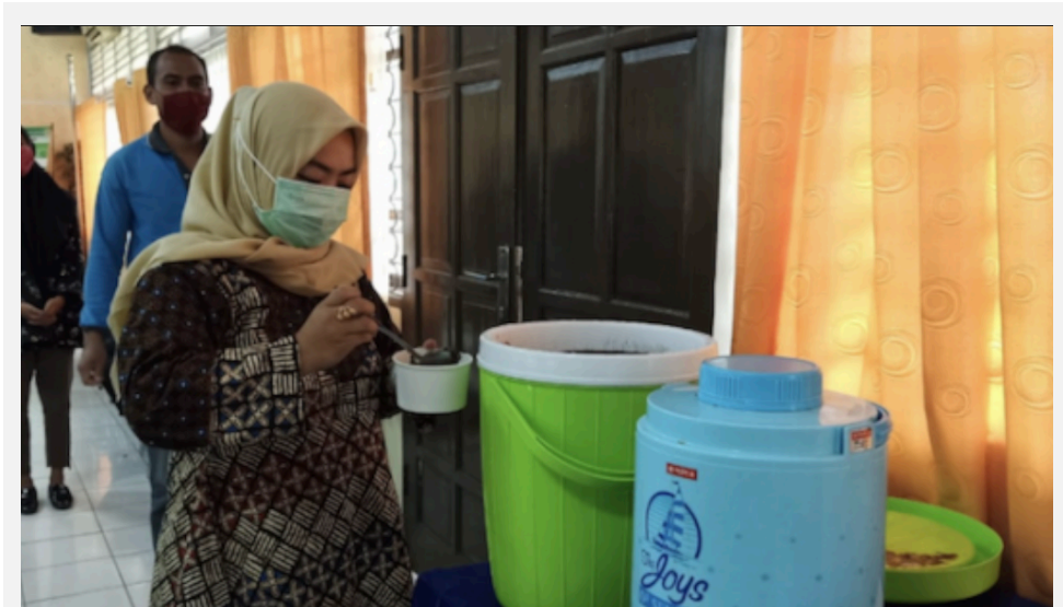
Gambar 4. Kegiatan Coffee Morning

Berikut disajikan beberapa foto kegiatan membangun organisasi pembelajaran :