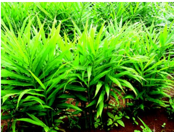
Gambar 1. Pertanaman jahe putih besar umur 6 bulan.

Pengendalian OPT. Produksi benih unggul bermutu menghadapi berbagai kendala, antara lain serangan OPT seperti penyakit layu bakteri, fusarium, nematoda, bercak daun, lalat rimpang, kutu perisai, dan penggerek batang (Balfas et al. 2011; Hartati et al. 2011). Kerugian akibat serangan OPT secara nasional diperkirakan sekitar 15–25%. Kehilangan hasil pada area pengembangan jahe seluas 10.000 ha dapat mencapai ± 50.000 ton jahe segar/tahun (Januwati 1999 dalam Syakir et al. 2008).