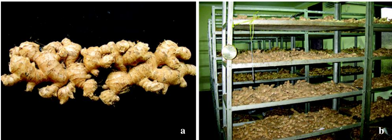
Gambar 2. Benih/rimpang jahe putih besar sebelum disimpan (a), dan penyimpanan benih rimpang jahe (b).

2004, 2005, 2007, 2008). Namun, penyimpanan benih lebih dari 3–4 bulan harus dilakukan di dataran tinggi. Sukarman dan Seswita (2012) memproduksi benih/rimpang jahe di daerah dataran tinggi (1.400 dpl), dengan rata-rata suhu harian 19,25°C dan kelembapan 90,1%. Cara ini dapat mempertahankan daya tumbuh benih > 90% dengan susut bobot 19,88%, hingga penyimpanan selama 6 bulan, dan secara ekonomi layak diusahakan (Ermianti dan Sukarman 2011).