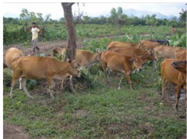
Gambar 1. Merah bata mendominasi warna bulu sapi pesisir.

Faktor lingkungan terutama padang penggembalaan sangat berperan dalam menyediakan pakan untuk mendukung pertumbuhan sapi pesisir. Huyen et al. (2011) menyatakan tampilan sapi sangat dipengaruhi oleh manajemen pakan dan bangsa sapi. Sapi muda membutuhkan pakan yang mengandung protein dan energi tinggi untuk pertumbuhan otot, tulang, dan lemak. Menurut Adiwarti et al. (2011), pertumbuhan meru-pakan tolok ukur yang paling mudah untuk menilai produktivitas, tinggi pundak, panjang badan, dan lingkaran dada. Selanjutnya Siregar dan Hasanah (1986) menyatakan kenaikan bobot badan merefleksikan tingkat pertumbuhan ternak.