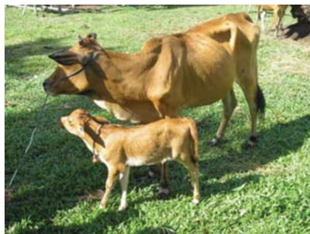
Gambar 3. Keragaan sapi pesisir produktif.

Produksi rumput padang penggembalaan dapat dilihat pada hasil pengkajian BPTP Sumatera Barat selama bulan Juni–Agustus 2005. Ditinjau dari kondisi iklim, pada pertengahan Juni menjelang musim kemarau pertumbuhan rumput masih baik. Pada bulan tersebut, padang penggembalaan belum terjadi over grazing meskipun ternak