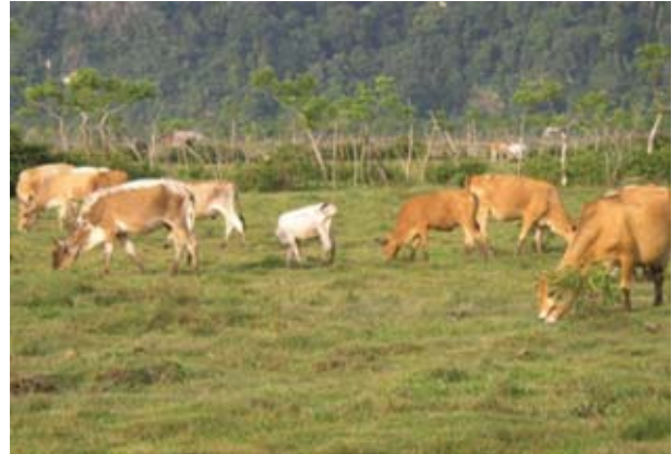
Gambar 2. Kondisi padang penggembalaan sapi pesisir.

Sapi pesisir dipelihara secara tradisional dengan mengandalkan rumput di padang penggembalaan, lahan kosong, dan sawah tadah hujan. Bahkan sapi lokal ini ditemui mencari rumput di pinggir jalan atau berkeliaran di