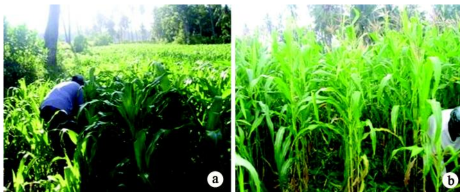
Gambar 1. Aktivitas panen brangkasan pada penanaman jagung dengan sistem pengaturan jarak tanam dan waktu panen, yaitu penjarangan tanaman dengan cara panen brangkasan pada umur 45 hst (a), dan pada umur 75 hst (b) (Syafruddin et al. 2005).

Hasil analisis laboratorium menunjukkan bahwa brangkasan jagung yang