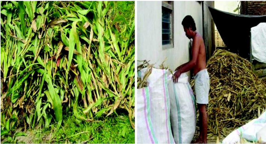
Gambar 3. Brangkasian jagung dengan proses penyimpanannya sebagai pakan ternak (Syafuruddin et al. 2005).

diolah memiliki kualitas yang lebih baik sebagai bahan pakan dibanding tanpa pengolahan (Tabel 4). Pengolahan dan fermentasi dapat meningkatkan kualitas brangkasian jagung yang diperoleh dari berbagai umur tanaman. Hasil penelitian Syafuruddin et al. (2005) memperlihatkan bahwa kualitas pakan ternak yang berasal dari brangkasian jagung yang dipanen pada waktu tertentu cukup baik dan memenuhi syarat minimal kebutuhan ternak, dengan kandungan protein kasar cukup tinggi, yaitu 8,29–10,83%, dan lemak kasar 2,30–2,71%, jauh lebih tinggi dibanding kualitas pakan yang dihasilkan petani (Tabel 4). Begitu pula dengan brangkasian yang diperoleh dari tanaman lain, seperti gandum. Kualitas gizi brangkasian tanaman gandum yang dipanen pada waktu tertentu hingga tanaman menjelang berbunga tidak berbeda dengan kadar protein kasar 7,16–11,78% (Sajimin et al. 2003).