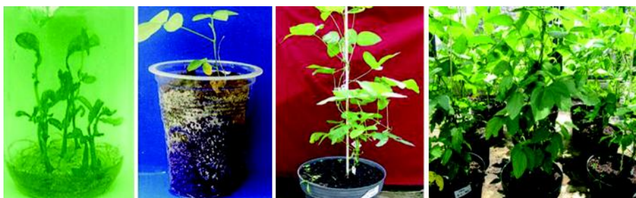
Bibit kultur hasil regenerasi in vitro .

Salah satu faktor yang sangat menentukan keberhasilan aklimatisasi adalah perakaran. Akar yang makin banyak dan panjang akan meningkatkan bidang serapan hara (Lestari et al. 1999). Jangkauan akar yang luas dapat memenuhi kebutuhan air secara cepat yang