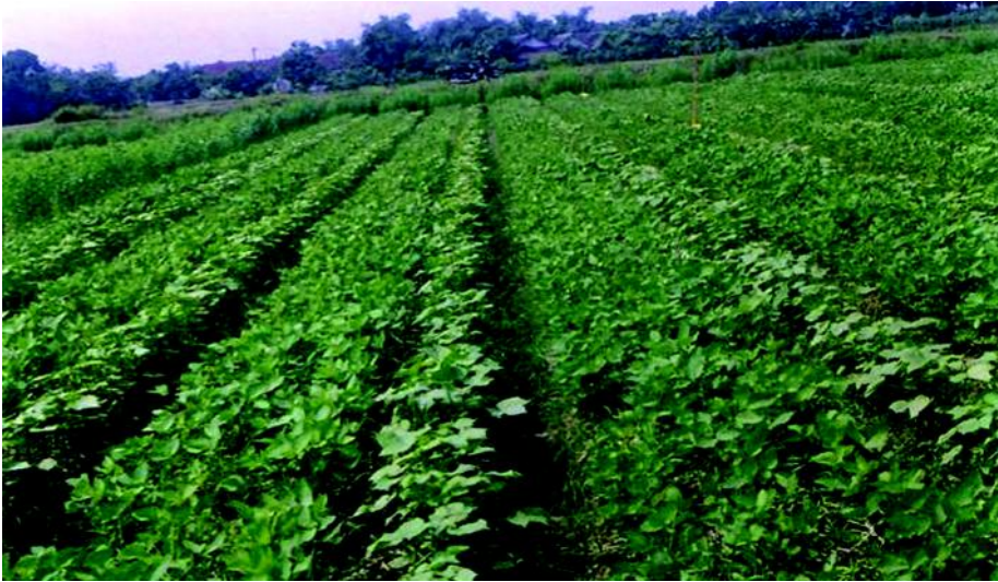
Gambar 1. Penanaman kapas secara tumpang sari dengan kedelai menambah keragaman tanaman.

varietas kapas yang toleran terhadap wereng kapas. Varietas kapas yang ada, yaitu Kanesia 1 sampai 15 bersifat moderat tahan terhadap wereng kapas. Perlakuan benih menyebabkan tanaman kapas mengandung insektisida hingga umur 45 hari sehingga terlindung dari serangan wereng kapas (Subiyakto dan Kartono 1988). Keuntungan pengendalian hama dengan perlakuan benih antara lain adalah kompatibel dengan cara pengendalian yang lain, mudah dilaksanakan, dan relatif aman terhadap lingkungan (Subiyakto 1999).