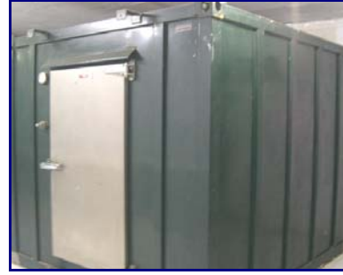
Gambar 6. Chiller untuk penyimpanan benih jangka menengah dan panjang