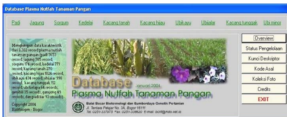
Gambar 23. Menu utama database plasma nutfah tanaman pangan.

Hingga Desember 2010, telah dikelola sebanyak 10.388 record yang meliputi 4.054 aksesori padi (32 deskriptor tanaman), 741 aksesori jagung (24 deskriptor), 226 aksesori sorgum (16 deskriptor), 988 aksesori kedelai (20 deskriptor), 795 aksesori kacang tanah (17 deskriptor), 1.024 aksesori kacang hijau (19 deskriptor), 452 aksesori ubi kayu (17 deskriptor), 1.358 aksesori ubi jalar (28 deskriptor), 120 aksesori kacang tunggak (17 deskriptor), 34 aksesori ubi kelapa (data paspor), 33 aksesori gembili (data paspor), 18 aksesori gadung (data paspor), 48 aksesori ganyong (data paspor), 221 aksesori talas (21