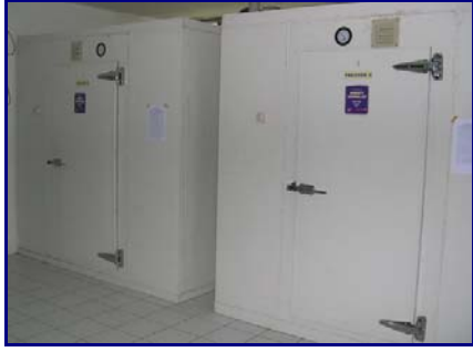
Gambar 5. Freezer untuk penyimpanan benih jangka menengah dan panjang