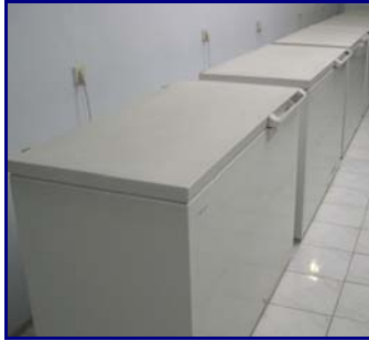
Gambar 7. Freezer untuk penyimpanan benih jangka panjang