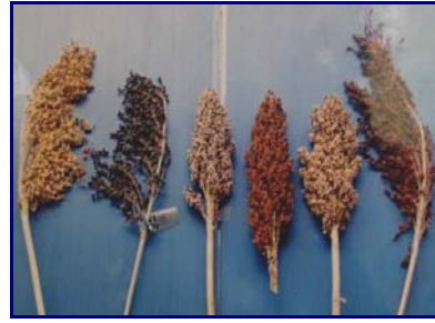
Gambar 18. Keragaman morfologi malai pada plasma nutfah sorgum