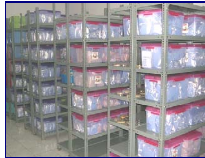
Gambar 2. Penyimpanan benih dalam ruang AC untuk jangka pendek