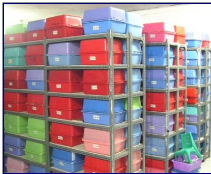
Gambar 3. Penyimpanan benih dalam ruang AC untuk jangka pendek