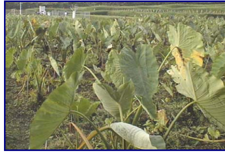
Gambar 12. Field gene bank plasma nutfah talas di Inlitbio Pacet, Cianjur