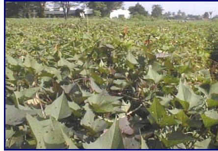
Gambar 8. Field gene bank ubi jalar di BB-Biogen, Bogor