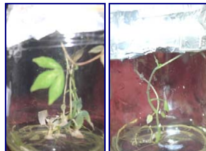
Gambar 16. Kultur in vitro plasma nutfah ubi kayu dan ubi jalar