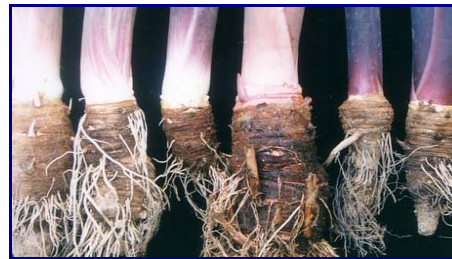
Gambar 22. Keragaman morfologi plasma nutfah talas