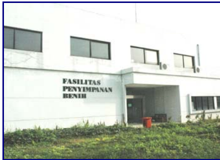
Gambar 1. Laboratorium Bank Gen dan Genetika Tanaman