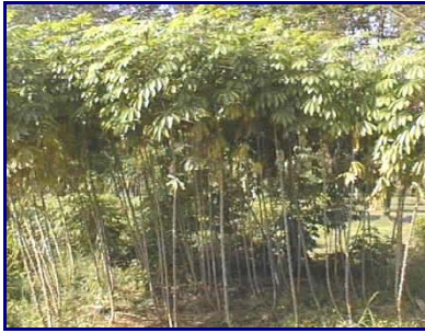
Gambar 11. Field gene bank plasma nutfah ubi kayu di BB-Biogen dan Inlitbio Muara, Bogor