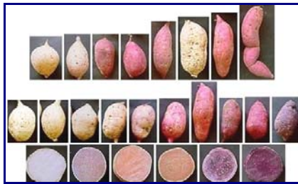
Gambar 21. Keragaman morfologi plasma nutfah ubi jalar