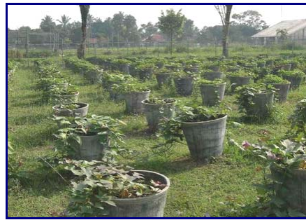
Gambar 10. Field gene bank koleksi inti ( core collection ) ubi jalar di BB-Biogen, Bogor