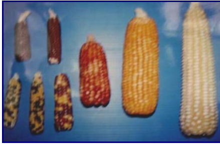
Gambar 17. Keragaman morfologi plasma nutfah jagung