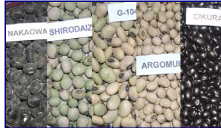
Gambar 20. Keragaman morfologi plasma nutfah kedelai