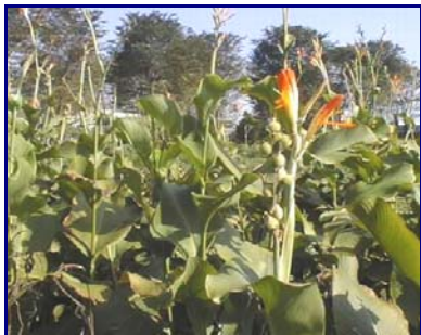
Gambar 13. Field gene bank plasma nutfah ganyong di BB-Biogen dan Inlitbio Cikeumeuh, Bogor