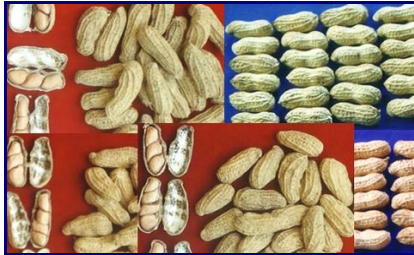
Gambar 19. Keragaman morfologi plasma nutfah kacang tanah