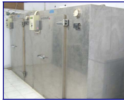
Gambar 4. Freezer untuk penyimpanan benih jangka menengah dan panjang