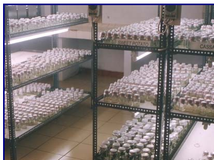
Gambar 15. Konservasi in vitro plasma nutfah ubi kayu, ubi jalar, dan talas di Laboratorium In Vitro , BB-Biogen, Bogor