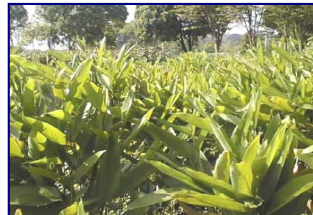
Gambar 14. Field gene bank plasma nutfah patat di BB-Biogen dan Inlitbio Cikeumeuh, Bogor