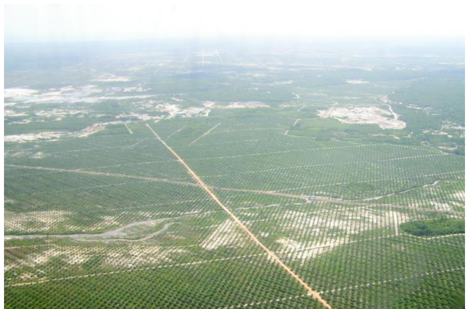
Gambar 4. Perkebunan kelapa sawit di Kabupaten Belitong.

Tata ruang komoditas, baik yang telah ada maupun yang akan dikembangkan di Babel perlu diatur agar tidak saling menekan atau meniadakan. Tanaman perkebunan tradisional seperti lada, karet, dan kelapa yang telah diusahakan masyarakat