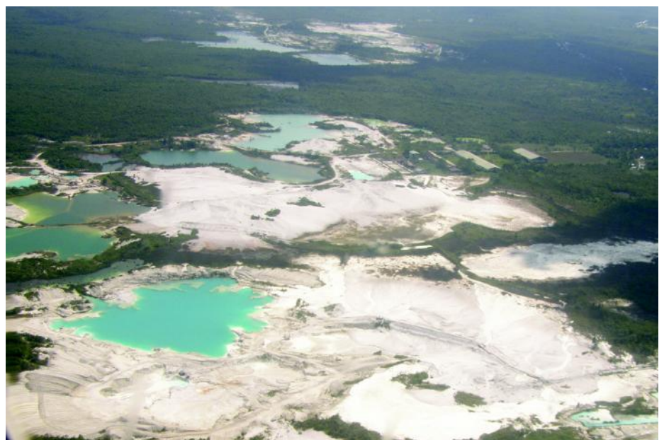
Gambar 3. Lahan bekas tambang (kolong) timah.

Ada sembilan komoditas perkebunan yang dikembangkan di Babel, yaitu lada,