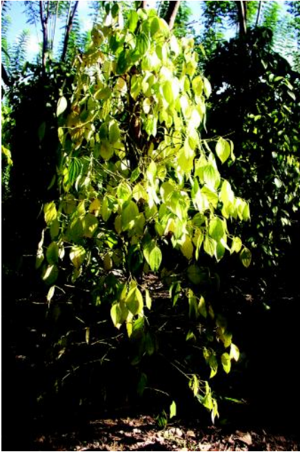
Gambar 2. Tanaman lada terserang penyakit kuning.

rusak, terdapat luka nekrosis dan puru (bintil-bintil akar berisi nematoda). Selain penyakit kuning, penyakit busuk pangkal batang (BPB) yang disebabkan oleh P. capsici juga menyerang pertanaman lada di Bangka (Mulia et al. 2003).