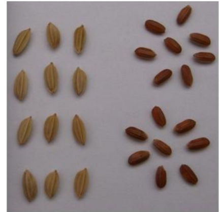
Gambar 3. Gabah dan beras varietas padi beras merah Badigul yang berukuran pendek.