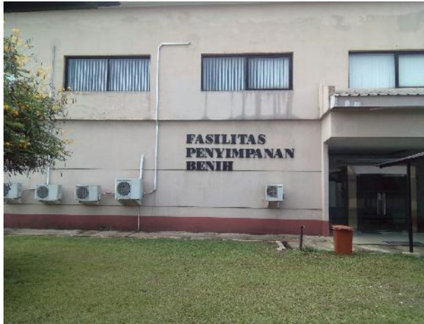
Gambar 5. Gedung penyimpanan benih tanaman pangan (dok. Afza).