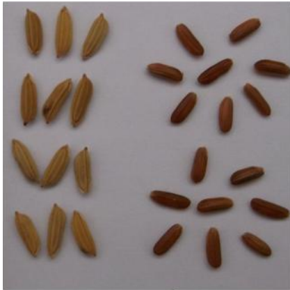
Gambar 1. Gabah dan beras varietas padi beras merah Mantja Sumbawa yang berukuran panjang.