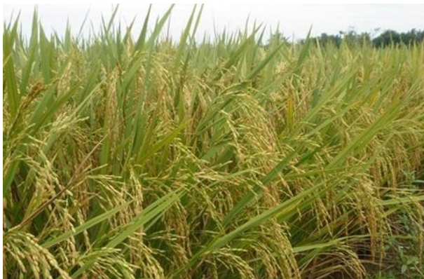
Gambar 4. Padi Inpago 7 (Balai Besar Padi 2011).

Postur tanaman padi beras merah yang tinggi juga menurunkan preferensi petani untuk menanam padi beras merah. Beras yang populer di kalangan petani ialah beras putih dengan tinggi tanaman kurang dari 1 m dan berumur genjah. Menurut Budiman et al. (2012), jangka waktu tumbuh yang panjang menyebabkan budi daya padi beras merah di Indonesia kurang berkembang. Postur padi beras merah lokal yang dapat mencapai 2 m ditambah umur tanaman lebih dari 6 bulan membuat petani enggan membudidayakannya. Padi beras merah jenis Barak Cendana yang berasal dari Bali telah mengalami pemuliaan sehingga umurnya berkurang menjadi 120 hari (Safitri 2014).