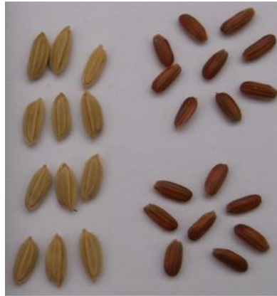
Gambar 2. Gabah dan beras varietas padi beras merah Sitopas yang berukuran menengah/ sedang (dok. Afza).