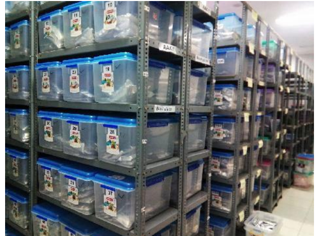
Gambar 6. Penyimpanan benih padi di dalam boks di ruang penyimpanan benih bersuhu 15–20° C.