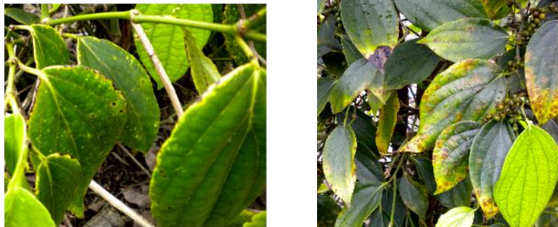
Gambar 2. Tanaman lada dewasa (TM) kekurangan unsur hara K Figure 2. Mature black pepper (TM) deficiency of K in mature black pepper

Keterangan: - = Tidak dianalisa, not analyzed