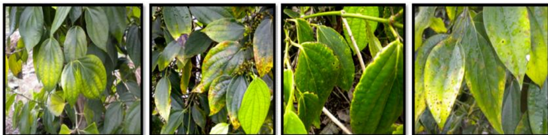
Gambar 1. Variasi gejala kekurangan hara pada tanaman lada di Babel Figure 1. Various deficiency symptoms in black pepper grown in Babel

Di sejumlah kebun lada petani yang disurvei, banyak tanaman lada memperlihatkan pertumbuhan tidak normal (abnormal) dengan penyebab yang tidak jelas atau kompleks (diduga lebih dari satu faktor). Sebagian tanaman lada yang rusak atau mati disebabkan murni karena terserang penyakit kuning dan/busuk pangkal batang (BPB) dengan gejala khas. Sebagian lagi, tanaman lada rusak disebabkan faktor perawatan yang kurang, termasuk pemberian pupuk yang diperkirakan tidak mencukupi kebutuhan minimal tanaman. Hal ini diperlihatkan oleh munculnya beragam gejala kekahatan (defisiensi) hara tanaman (Gambar 2). Abnormalitas pertumbuhan dan perkembangan tanaman lada tidak hanya disebabkan oleh pemberian dosis pupuk N, P dan K yang rendah, tetapi juga diduga karena kekurangan unsur makro lainnya seperti Ca dan Mg. Pemberian unsur Ca dan Mg pada tanaman lada, mungkin tidak pernah dilakukan oleh petani. Dengan sering dijumpainya gejala kekahatan Ca dan/ Mg pada tanaman lada di sejumlah kebun lada merupakan petunjuk bahwa status unsur tersebut diduga telah menjadi masalah atau kendala usahatani lada.