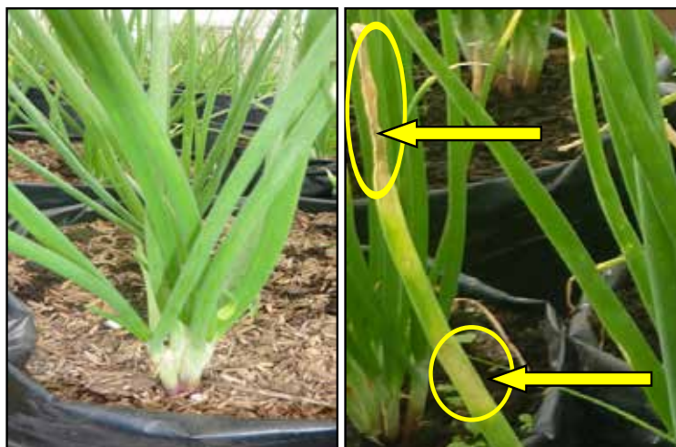
Gambar 1. Tanaman yang sehat sebelum terserang penyakit antraknos pada 14 HST (kiri), tanaman yang terserang penyakit antraknos pada 40 HST (kanan) [Healthy plant before attracted antrachnose disease at 14 DAP (left), antrachnose diseased plant at 40 DAP (right)]

Serangan penyakit berlangsung sampai umur 80 hari atau 11 MST. Daun-daun yang terserang antraknos berwarna kuning mulai dari ujung daun terus menyebar ke bagian bawah. Untuk menyelamatkan tanaman bawang merah dilakukan perompesan daun-daun yang terserang dan dilakukan penyemprotan fungisida.