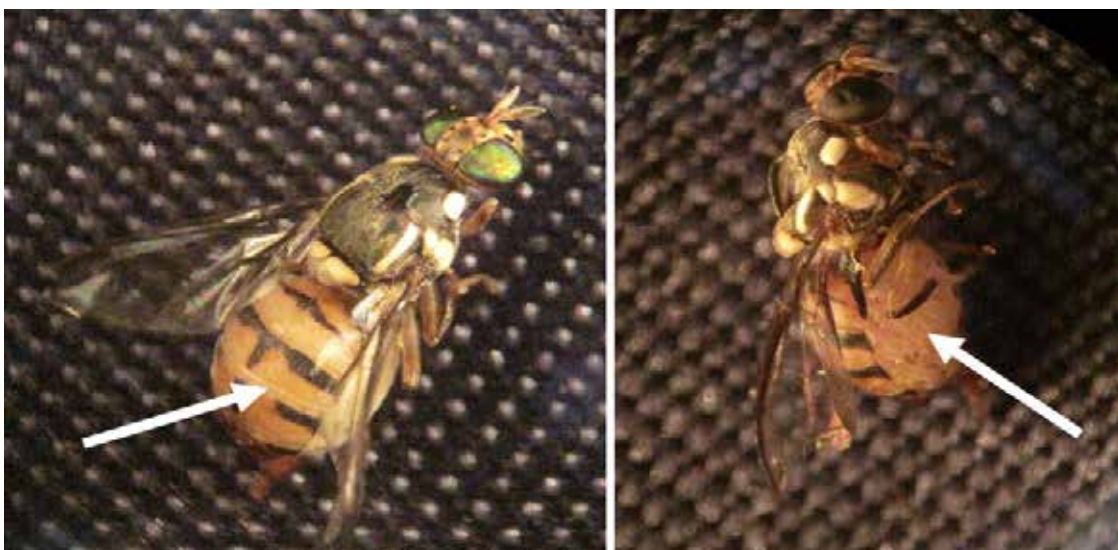
Gambar 3. Imago betina yang abnormal dengan abdomen yang membesar ( Abnormal female imago with enlarged abdomen )

secara nyata dibandingkan dengan perlakuan betina yang dikawinkan dengan jantan yang diberi ME. Hal itu menunjukkan bahwa konsumsi ME tidak berpengaruh positif terhadap viabilitas telur betina yang dikawinkan dengan jantan yang diberi ME. Pada perlakuan betina yang tidak mengonsumsi PH, baik yang dikawinkan dengan jantan diberi ME maupun tidak diberi ME, viabilitasnya nol karena tidak ada telur yang diletakkan betina. Rendahnya jumlah telur yang menetas diduga karena pengaruh lingkungan seperti suhu dan kelembaban. Menurut Siwi et al. (2006), kondisi optimum perkembangan lalat buah berkisar