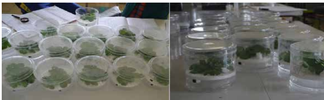
Gambar 2. Uji pendahuluan untuk menentukan kemangkusan beberapa induser dilakukan dalam toples plastik ( A preliminary test to determine effectiveness of some inducers performed in plastic jars )

mortal sampai halus dan diencerkan 1:1 (w/v), yaitu 100 g bagian bahan tananam, ditambah 100 ml 0,01 M fosfat buffer pH 7,0 (Duriat 2008).