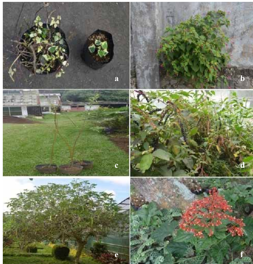
Gambar 1. (a) Tanaman ivy ( Hedera helix ), (b) tanaman bunga pukul empat ( Mirabilis jalapa ), (c) tanaman willow ( Salix sp.), (d) tanaman Phytolacca americana , (e) tanaman kecubung ( Datura suaveolens/Brumansia suaveolens ), (f) tanaman pagoda ( Clerodendron japonicum ), enam dari tujuh spesies tanaman elisitor sebagai bahan induser yang digunakan pada percobaan skala laboratorium dan rumah kaca ( Six of the seven species of plant elicitor as an inducer of materials used in laboratory-scale experiments and greenhouses )